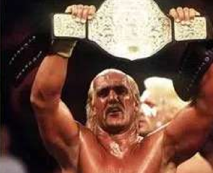
హోగన్కు డబ్ల్యూడబ్ల్యూఈ హాల్ ఆఫ్ ఫేమర్లలో కూడా చోటు దక్కింది. 1984లో హోగన్ తన తొలి డబ్ల్యూడబ్ల్యూఎఫ్ ఛాంపియన్షిప్ను జైతం చేసుకున్నాడు. హోగన్ తన కెరీర్ ఉన్నతంలో ఆండ్రి ద జెయింటీ, మాచ్ మ్యాన్ అండ్ సావేజ్, అల్టిమేట్ వారియర్ లాంటి దిగ్గజ రజ్జర్లతో కన్న పడ్డాడు.