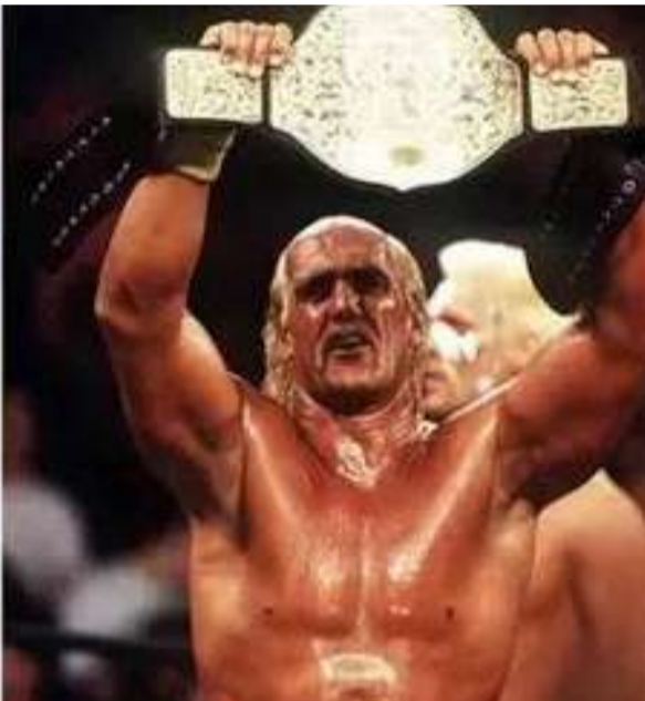
హోగన్కు అతని మీసాలు చాలా ప్రత్యేకతనిచ్చాయి. హోగన్ రజ్జర్గా కాకుండా సినిమాలు, టీవీ రియాలిటీ షోల్లో కూడా నటించాడు. హోగన్ గడిచిన అమెరికా అర్చక ఎన్నికల్లో డోనాల్డ్ ట్రంప్ తరఫున ప్రచారం చేశాడు. హోగన్కు భారత్లోనూ ఫ్యాన్స్ ఉన్నారు. 80వ దశకంలో పిల్లలకు హోగన్ సుపరిచితుడు.

1953 ఆగస్ట్ 11న జన్మించిన హోగన్ అసలు పేరు టెర్రి జీన్ బోల్ట్రయా. 80వ దశకంలో హోగన్ డబ్ల్యూ డబ్ల్యూఎఫ్ ద్వారా విశేష ప్రజాదరణ పొందారు. హోగన్ డబ్ల్యూడబ్ల్యూఎఫ్ రెజిల్ మానియాలిని తొలి తొమ్మిది ఎడిషన్లలో ఎనిమిది టైటిళ్లు సాధించాడు.