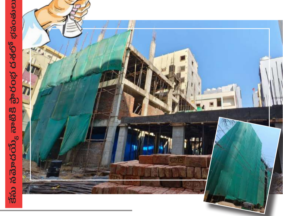
కేసు నమోదయ్యే నాటికి ప్రారంభ దశలో భవంతులు

అంజయ్యనగర్ లో యదేచ్ఛగా భారీ బహుళ అంతస్తుల నిర్మాణం