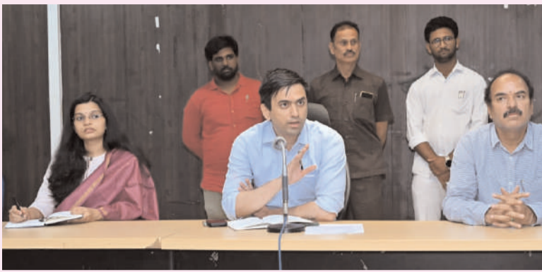
చిత్తూరు, చిత్తూరు ఎక్స్ ప్రెస్, జూన్ 11: