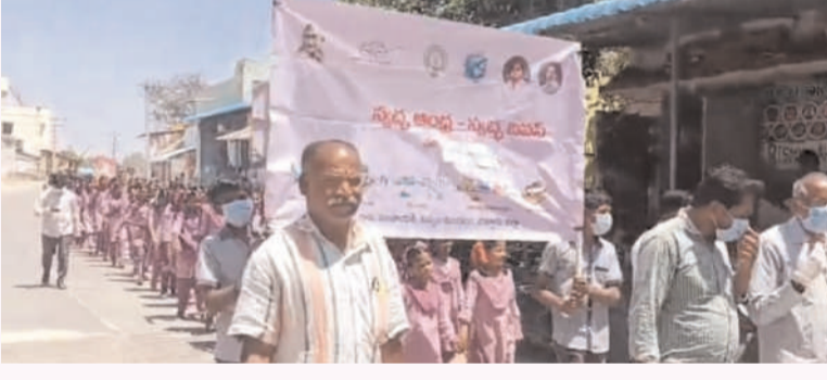
కుప్పం, చిత్తూరు ఎక్స్ ప్రెస్, జూలై 19:

కుప్పం నియోజకవర్గంలోని కంగుంది పంచాయతీ పరిధిలో స్వచ్ఛ, ప్లాస్టిక్ నిర్మూలన, వ్యర్థాల నిర్వహణపై అవగాహన కార్యక్రమం నిర్వహించబడింది. ఈ కార్యక్రమంలో జడ్పీ హెచ్ఎస్ పాఠశాల విద్యార్థులు పాల్గొని పల్లె స్వచ్ఛతపై సందేశాన్ని ప్రజలకు వినిపించారు. విద్యార్థులు ఊరంతా ర్యాలీ నిర్వహించి, పారిశుధ్యంపై నినాదాలు చేసి ప్రజల్లో చైతన్యం కలిగించారు. ఈ కార్యక్రమానికి స్థానిక ప్రజాప్రతి నిధులు, పార్టీ నాయకులు, అధికారులు హాజరై విద్యార్థులను అభినందించారు. స్వచ్ఛమైన సమాజ నిర్మాణం, కోసం ఈ తరహా కార్యక్రమాలు గ్రామస్థాయిలో నిర్వహించడం అభినందనీయం అని వారు తెలిపారు.