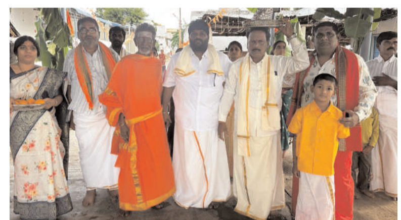
వెదురుకుప్పం, చిత్తూరు ఎక్స్ ప్రెస్, జూలై 19: