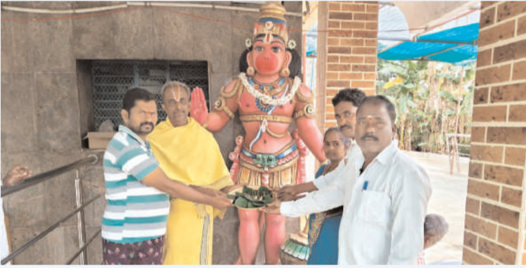
చౌడేశ్వరి, చిత్తూరు ఎక్స్ ప్రెస్, జూలై 19: