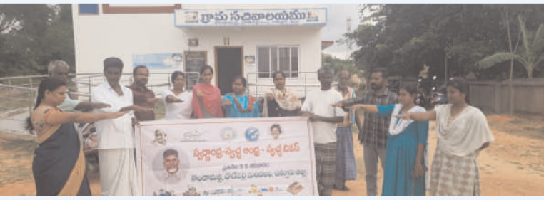
చౌడేశ్వరి, చిత్తూరు ఎక్స్ ప్రెస్,జూలై 19

చౌడేశ్వరిమండలంలోని పంచాయతీ కేంద్రం పెద్దకొండమల్ల గ్రామపంచాయతీలో పంచాయతీ సెక్రటరీ నిలవతి ఆధ్వర్యంలో స్వచ్ఛఆంధ్రస్వర్ణాంధ్ర కార్యక్రమంలో భాగంగా శనివారం పెద్దకొండమల్ల నవివాలయందగ్గర ర్యాలీ నిర్వహించారు. మొక్కలు నాటడం నవివాలయం ఆవరణము పరిసరాలను శుభ్రపరిచే కార్యక్రమం ఘనంగా నిర్వహించారు. ఈ కార్యక్రమంలో పంచాయతీ సెక్రటరీ నిలవతి హెల్మెట్ డిపా రైంట్ మీనావెటర్నరీ డిపార్ట్మెంట్ హరిత గ్రామపంచాయతీ సర్వేయర్ పారిశుధ్య కార్మిక సిద్ధింది, నవివాలయం దగ్గర ఉన్న కొంత మంది రైతులు పాల్గొన్నారు.