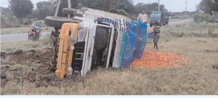
చౌడేశ్వరి, చిత్తూరు ఎక్స్ ప్రెస్,జూలై 19: