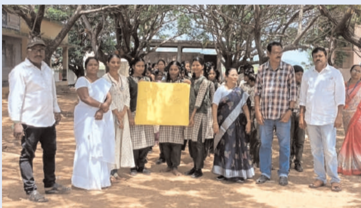
శ్రీకాళహస్తి, చిత్తూరు ఎక్స్ ప్రెస్, జూలై 30: