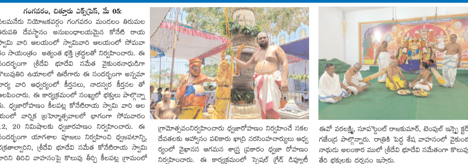
గంగవరం, చిత్తూరు ఎక్స్ ప్రెస్, మే 05:

పలమనేరు నియోజకవర్గం గంగవరం మండలం తిరుమల తిరుపతి దేవస్థానం అనుబంధాలయమైన కోనేటి రాయ స్వామి వారి ఆలయంలో స్వామివారి ఆలయంలో సోమవారం సాయంత్రం అత్యంత భక్తి శ్రద్ధలతో నిర్వహించారు. ఈ సందర్భంగా శ్రీదేవి భూదేవి సమేత వైకుంఠనాథుడిగా కొలువైతూ ఉయ్యాలలో ఊరేగారు ఈ సందర్భంగా అన్నమాచార్య వారి ఆధ్వర్యంలో కీర్తనలు, నాదస్వర కీర్తనలతో ఆలవించారు. ఈ కార్యక్రమంలో సంఖ్యలో భక్తులు పాల్గొన్నారు. ధ్వజారోహణం కీలపల్లి కోనేటిరాయ స్వామి వారి ఆలయంలో వార్షిక బ్రహ్మోత్సవాలలో భాగంగా సోమవారం 12, 20 నిమిషాలకు ధ్వజారోహణం నిర్వహించారు. ఈ సందర్భంగా యాగశాల పూజలు నిర్వహించి ధ్వజపటాన్ని చక్రతాలాన్ని, శ్రీదేవి భూదేవి సమేత కోనేటిరాయ స్వామి వారిని తిరిచి వాహనంపై కొలువు తీర్చి కీలపల్లి గ్రామంలో