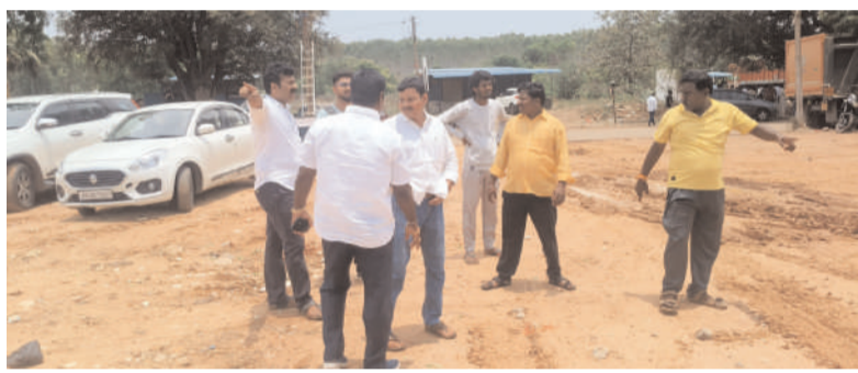
సత్యవేడు, చిత్తూరు ఎక్స్ ప్రెస్, మే 05:

ఈనెల 7న తెలుగుదేశం పార్టీ జాతీయ ప్రధాన కార్యదర్శి, మంత్రి నారా లోకేశ్ సత్యవేడు నియోజకవర్గ పర్యటన ఖరారైన నేపథ్యంలో సత్యవేడు సంత మైదానంలో భారీ బహిరంగ సభకు ఏర్పాట్లు చకచకా సాగుతున్నాయి. సత్యవేడు చంద్రుడు - నియోజకవర్గ పరిశీలకులు చంద్ర శేఖర్ నాయుడు దగ్గరుండి, నాయకులు, కార్యకర్తలతో కలిసి ఏర్పాట్లను ప్రత్యక్షంగా పర్యవేక్షిస్తున్నారు. నియోజకవర్గ నలుమూలల నుండి నాయకులు, కార్యకర్తలు భారీ సంఖ్యలో తరలి వచ్చే అవకాశం ఉన్నందున, ఇబ్బందులు తలెత్తకుండా మండల స్థాయి ఏర్పాట్లను చేస్తున్నట్లు సత్యవేడు చంద్రుడు పేర్కొన్నారు. ప్రధానంగా మంత్రి లోకేశ్, నాయకులతో, కార్యకర్తలతో బేరీ అయిన తర్వాత నియోజకవర్గ సమస్యలపై - పరిష్కార మార్గాలపై సుదీర్ఘ చర్చలు జరుగుతున్నట్లు ఆయన తెలిపారు.