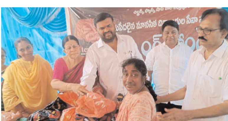
శ్రీకాళహస్తి, చిత్తూరు ఎక్స్ ప్రెస్, మే 05: