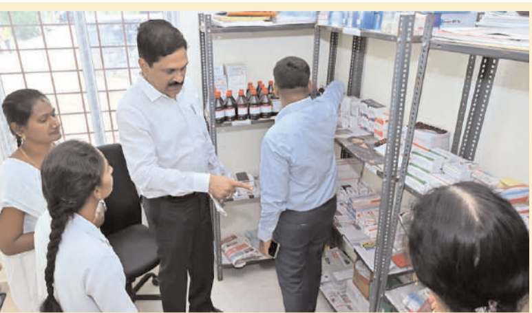
కుప్పం, చిత్తూరు ఎక్స్ ప్రెస్, మే 05: