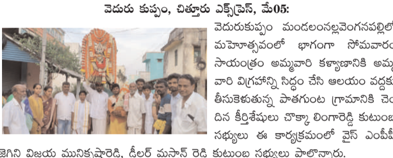
వెదురు కుప్పం, చిత్తూరు ఎక్స్ ప్రెస్, మే05: