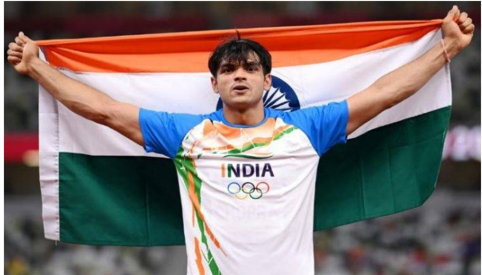
అత్యున్నత క్రీడా పురస్కారం మేజర్ ధ్యా న్చంద్ ఖేల్నా పురస్కారాన్ని కూడా నీరజ్ అందుకున్నారు. అంతేగాక 2022లో పద్మశ్రీ అవార్డు కూడా నీరజ్ కు వరించింది. కాగా, భారత క్రీడాకారిణికి చెందిన ఎంఎస్ ధోనీ, కపిల్ దేవ్, అభినవ్ బింద్రా తదితరులు టెలివీరియల్ ఆర్కైవ్ లో లెజెండ్ కర్నల్ హోదాను దక్కించుకున్నారు. తాజాగా వీరి సరసన నీరజ్ చోప్రా చేరారు.

మనగళం ఒలింపిక్ స్వర్ణ పతక విజేత, భారత దిగ్గజ అథ్లెట్ నీరజ్ చోప్రాకు అరుదైన గౌరవం లభించింది. టెలివీరియల్ ఆర్కైవ్ లో నీరజ్ కు లెజెండ్ కర్నల్ గౌరవ హోదాను ప్రధానం చేశారు. ఈ విషయాన్ని భారత రక్షణ మంత్రిత్వ శాఖ బుధవారం అధికారికంగా ప్రకటించింది. ఇది ఈ ఏడాది ఏప్రిల్ 16 నుంచి అమల్లోకి వస్తుందని ఆ ప్రకటనలో వెల్లడించింది. గతంలో నీరజ్ చోప్రా భారత సైన్యంలో సుబేదార్ గా వ్యవహరించారు. తాజాగా ఆయనకు ప్రతిష్టాత్మకమైన లెజెండ్ కర్నల్ హోదా లభించింది. టోక్యో వేదికగా జరిగిన ఒలింపిక్ లో నీరజ్ చోప్రా జావెలిన్ త్రో విభాగంలో స్వర్ణ పతకం సాధించి చరిత్ర సృష్టించారు. ఈ క్రమంలో ఒలింపిక్స్ అథ్లెటిక్స్ వ్యక్తిగత విభాగంలో పసిడి పతకం సాధించిన తొలి భారత క్రీడాకారుడిగా అరుదైన గౌరవాన్ని దక్కించుకున్నారు. అంతేగాక పారిస్ లో జరిగిన ఒలింపిక్ లో కూడా నీరజ్ పతకం సాధించారు. ఈ క్రీడల్లో ఆయన రజతం గెలిచారు. కాగా, నీరజ్ కు పలు ప్రతిష్టాత్మకమైన పురస్కారాలు లభించాయి. కేంద్ర ప్రభుత్వం నీరజ్ కు పరమ విశిష్ట సేవా పతకంతో సత్కరించింది. అంతేగాక భారత