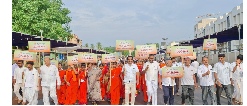
కార్యక్రమంలో పలు విభాగాల అధికారులు, సిబ్బంది, శివసేవకులు పాల్గొన్నారు