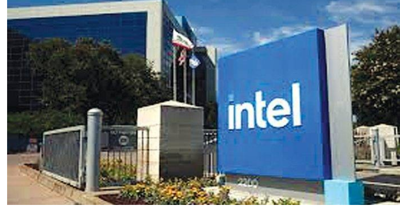
మ్యూనుఫ్యాక్చరీంగ్ బిస్ నాగ చంద్రశేఖరన్ పేర్కొన్నారు. ఇంతక్రితం ఇంటెల్ 2024లో 15,000 మంది ఉద్యోగులను తొలగించింది. ఇందులో ఒరెగాన్ లో 3,000 మంది నిబ్బంది ఉన్నారు. మరోమారు ఒరెగాన్ ఉద్యోగులపై వేటు పడుతుందని అంచనా.

మనగళం : ప్రముఖ టెక్ దిగ్గజం ఇంటెల్ భారీగా ఉద్యోగులు, కార్మికులను ఇంటికి పంపించే పనిలో ఉంది. ఇప్పటికే వేలాది మందిని తొలగించిన ఈ సంస్థ వచ్చే వారాల్లో మరింత మందిపై వేటు వేయడానికి సిద్ధం అవుతోంది. తదుపరి తొలగింపుల్లో ఫ్యాక్టరీలో పని చేసే 15-20 శాతం మంది ఉద్యోగులపై ప్రభావం ఉండొచ్చని రిపోర్టులు వస్తోన్నాయి. ఇంటెల్ నూతన సిజిఒ టామ్ మార్క్విట్ బాధ్యతలు స్వీకరించినప్పటి నుంచి ఆయన పొడుపు చర్యలకు ప్రణాళికలు రూపొందించారు. కంపెనీ విడుదల చేసిన అంతర్గత మెమో ప్రకారం ఇంటెల్ లో కొత్త విదేశ తొలగింపులు జాప్య మధ్యలో ప్రారంభమై నెలకొన్న నాటికి ముగిసే అవకాశం ఉందని తెలుస్తోంది. ఈ నిర్ణయం చాలా బాధాకరమైనదే.. కానీ పరిశ్రమ సవాళ్లను పరిష్కరించడానికి, కార్యాచరణ సామర్థ్యాన్ని మెరుగుపరచడానికి ఎంతో అవసరమనం ఇంటెల్ బిస్