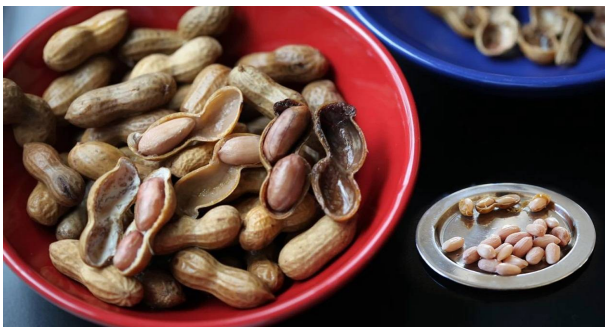
ఉంటాయి. వీటి వల్ల చర్మానికి, ఆరోగ్యానికి, జుట్టుకు మంచిది. ఇవి శరీరంలోని శ్రీ రాడికల్స్ తో పోరాడుతాయి. అదే విధంగా ఆక్సిడేటివ్ స్ట్రెస్ ను కూడా తగ్గిస్తాయి.

మెదడు పనితీరు మెరుగుపడటమే కాదు యాక్టివ్ గా ఉంటుంది. మతిమరుపు సమస్య తగ్గి జ్ఞాపక శక్తి పెరుగుతుంది. పిల్లలకు ఇవ్వడం వల్ల బ్రెయిన్ పెరుగుదల బాగుంటుంది అంటున్నారు నిపుణులు. బరువు నియంత్రణ.. ఉడకబెట్టిన పల్లీల వల్ల బరువు నియంత్రణలో ఉంటుంది. వీటిలో కేలరీలు తక్కువగా, ఫైబర్, ప్రోటీన్ లు ఎక్కువగా ఉంటాయి. కొద్దిగా తీసుకున్నా కడుపు నిండిన భావన ఉంటుంది. దీని వల్ల ఆహార పదార్థాలు తీసుకోవడం కాబట్టి వెయిట్ లాస్ అవుతారు. యాంటీ ఆక్సిడెంట్లు.. ఉడకబెట్టిన వేరుశనగ లో యాంటీ ఆక్సిడెంట్లు ఎక్కువగా