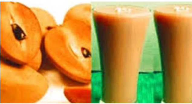
ఉంటుంది. అలాగే శరీరంలోని అవయవాలూ కూడా చాలా ఆరోగ్యంగా పనిచేస్తాయని నిపుణులు తెలియజేస్తున్నారు. మగవారు సపోటా జ్యూస్ ను ఎక్కువగా తాగడం వల్ల మంచి లాభాలు కలిగి ఉంటాయి.

ఉండే పొటాషియం గుండె కండరాల పనితీరును కూడా మెరుగుపరచడానికి ఉపయోగపడుతుంది. అలాగే రక్తపోటును కూడా నియంత్రించడానికి సహాయపడుతుంది. సపోటా జ్యూస్ తరచూ తాగడం వల్ల ఇందులో ఉండే క్యాల్షియం ఎముకలను బలోపేతంగా చేయడానికి ఉపయోగపడుతుంది. విటమిన్ ఏ సపోటాలో ఉండడం వల్ల కంటి సమస్యలను కూడా దూరం చేస్తుంది. అలాగే జలుబు ఘ్న వంటి వాటిని కూడా దరికి చేరనివ్వకుండా పోరాడేటటువంటి శక్తి ఇస్తుంది. జుట్టు రాల్చిపోతున్న సమస్యతో ఇబ్బంది పడేవారు వారానికి ఒక్కసారైనా సపోటా జ్యూస్ తాగడం వల్ల జుట్టు ఒత్తుగా పెరుగుతుంది. సపోటా జ్యూస్ ని తాగడం వల్ల తలలో బ్లడ్ సర్క్యులేషన్ చాలా చురుకుగా