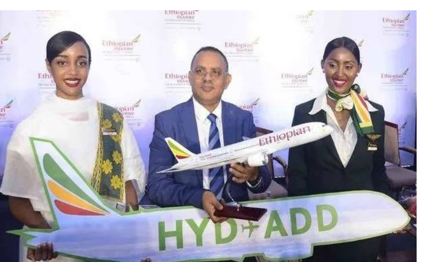
పాక్షికంగా ఫారూ ఉత్పత్తులను రవాణా చేసినట్లు వివరించారు. రానున్న రోజుల్లో ఫారూ సహా ఐటీ సంబంధిత ఎగుమతి సేవలను పూర్తి స్థాయిలో అందుబాటులోకి తీసుకురావాలని యోచిస్తున్నామన్నారు.