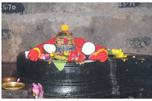
శిథిలావస్థలో ఉన్న ఈ మతాలలో ఘంటామఠం, విభూతిమఠం, రుద్రాక్షమఠాలను దేవస్థానం పూర్తిగా పునరుద్ధరించింది. ప్రాచీన నిర్మాణశైలికి ఎలాంటి విఘాతం కలుగకుండా ఈ పునర్నిర్మాణ పనులు పూర్తి చేయబడ్డాయి. అదేవిధంగా భీమశంకర మతానికి తగు మరమ్మత్తులు కూడా చేయబడ్డాయి. ఈ మతాలలోని దేవతామూర్తులకు నిత్యధూపదీప నివేదన కైంకర్యాలు జరిపించడం జరుగుతుంది.

ఘంటామఠంలోని గణపతికి పూజాదికాలు నిర్వహించబడ్డాయి. తరువాత అన్ని మతాలలో సంప్రదాయబద్ధంగా అభిషేకాది అర్చనలను నిర్వహించబడ్డాయి. కాగా శ్రీశైల సంస్కృతిలో చాలాకాలం పాటు మతాలు ప్రధానపాత్ర పోషించాయి. ప్రస్తుత సాధారణశకం 7వ శతాబ్దం నుంచి నిర్వహించబడ్డ ఈ మతాలు, గర్భాలయం, అంతరాలయం, ముఖమండపం లాంటి నిర్మాణాలను కలిగివుండి, చూడటానికి అలయాల మాదిరిగానే కనిపిస్తాయి. కొన్ని శతాబ్దాల నుండి కూడా ఈ మతాలన్నీ క్షేత్ర ప్రశాంతతలోనూ, ఆలయ నిర్వహణలోనూ, ఆధ్యాత్మికపరంగా, భక్తులకు సదుపాయాలను కల్పించడంలోనూ ప్రధాన భూమికను వహించాయి. శ్రీశైలంలో కొన్ని మతాలు కాలగర్భములో కలిసిపోగా, ప్రస్తుతం ఆలయానికి దగ్గరలో వాయవ్య భాగాన ఘంటామఠం, భీమశంకరమఠం, విభూతిమఠం, రుద్రాక్షమఠం, సారంగధరమఠం అనే మతాలు పంచమతాలనే పేర్లతో పిలువబడుతున్నాయి. కాగా