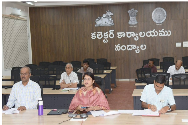
కలెక్టర్ కార్యాలయము నంద్యాల