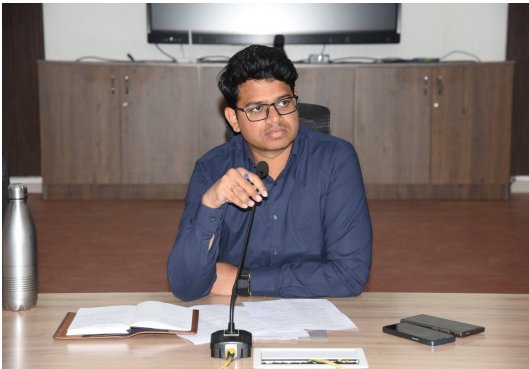
- నంద్యాల జాయింట్ కలెక్టర్ విష్ణు చరణ్

మనగళం, నంద్యాల: మెరుగైన భవిష్యత్తు నిర్మించడానికి సహకార సంఘాలు పునాది లాంటివని, జిల్లాలో సహకార సంఘాల బలోపేతానికి కృషి చేయాలని జాయింట్ కలెక్టర్ సి.విష్ణు చరణ్ సంబంధిత అధికారులను ఆదేశించారు.