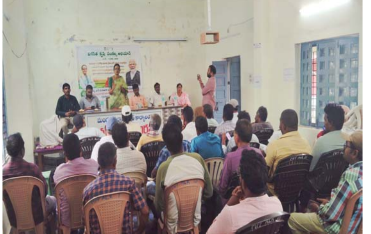
అల్లూరు స్వర్ణ సాగరం మే 29