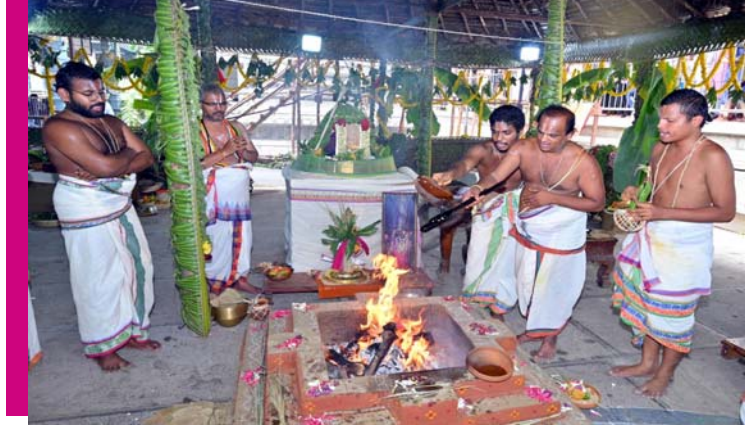
కాళిపాకం మే 29 స్వర్ణ సాగరం