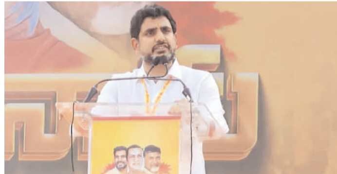
స్వర్ణసాగరం కడప దేవుని కడపలో మహానాడు నిర్వహించడం అదృష్టంగా భావిస్తున్నానని తెదేపా జాతీయ ప్రధాన కార్యదర్శి, మంత్రి నారా లోకేశ్ అన్నారు. మహానాడు బహిరంగ సభలో తన ప్రసంగంతో పార్టీ శ్రేణుల్లో ఉత్తేజం నింపారు. "తిరుమల తొలి గడప.. దేవుని కడప. దేవుని కడప, ఒంటిమిట్ట, అమీన్ పీర్ దర్గా ఉన్న - మిగతా3లో