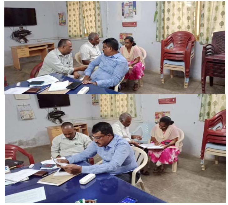
స్వర్ణ సాగరం - శ్రీకాళహస్తి