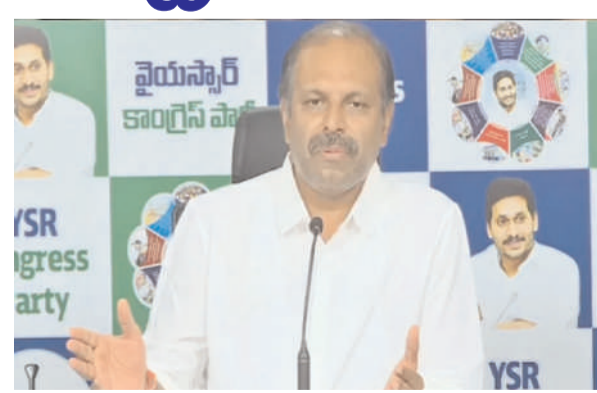
వైఎస్సార్ కాంగ్రెస్ పార్టీ వైఎస్ఆర్ కాంగ్రెస్ పార్టీ