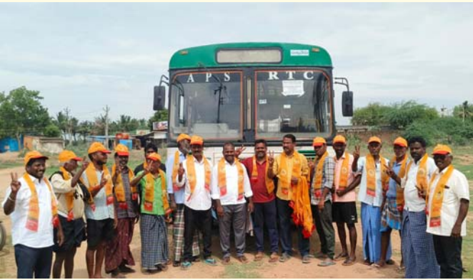
నాగలాపురం -స్వర్ణ సాగరం మే 29: