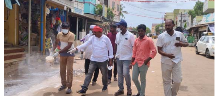
వెంకటాచలం స్వర్ణ సాగరం మే 29