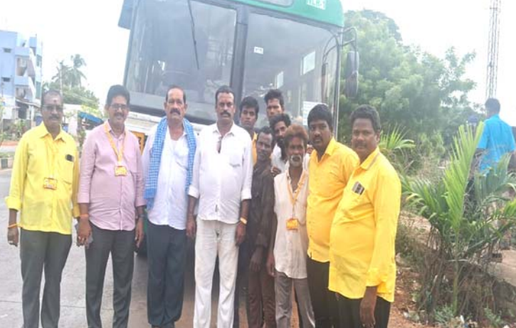
కృషి చేయాలి. చంద్రబాబు నాయుడు గారి నాయకత్వంలో, లోకేశ్ బాబు గారి సహకారంతో మనం పార్టీని మరింత ఉన్నత స్థాయికి తీసుకెళ్తాం. జై తెలుగుదేశం! జై జై చంద్రబాబు! జై లోకేశ్!"

నాయకత్వంలోనే రాష్ట్రం పెట్టుబడులకు గమ్యస్థానంగా మారింది, సంక్షేమ పథకాలు ప్రజల జీవితాల్లో వెలుగులు నింపాయి. ఆయన దార్శనికత, పరిపాలనా దక్షత అద్భుతం. "మన యువనేత నారా లోకేశ్ బాబు గురించి ఎంత చెప్పినా తక్కువే. యువతకు స్ఫూర్తిగా, పార్టీ భవిష్యత్తుకు ఆశాకీరణంగా లోకేశ్ బాబు నిలుస్తున్నారు. ఆయన యువతకు, మహిళలకు అందిస్తున్న ప్రోత్సాహం, డిజిటల్ రంగంలో ఆయన కృషి అభినందనీయం. ఆయన ప్రజా సమస్యలను అర్థం చేసుకుని, వాటి పరిష్కారానికి అహర్నిశలు కృషి చేస్తున్నారు. ఆయన నాయకత్వంలో పార్టీ మరింత బలోపేతం అవుతుంది అనడంలో సందేహం లేదు."