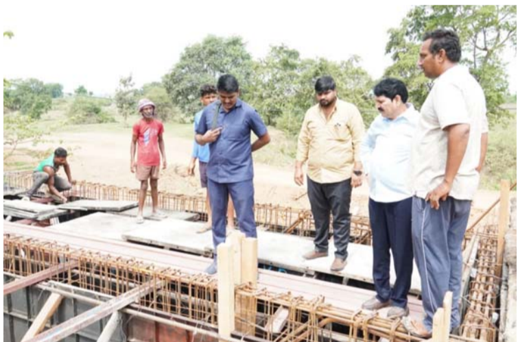
అక్షర విజేత, వెంకటాపురం.