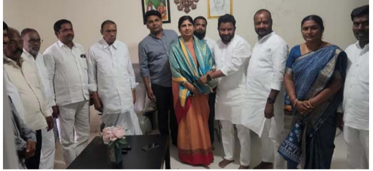
అక్షర విజేత ,శివపేట.