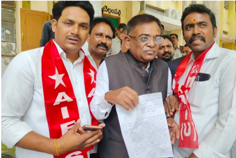
అక్షర విజేత, బెల్లంపల్లి