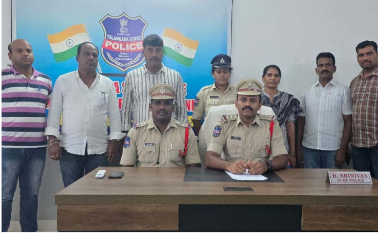
అక్షర విజేత, నిజామాబాద్ ప్రతినిధి :

ధర్మారం హత్య కేసు వివరాలు వెల్లడించిన పోలీసులు.