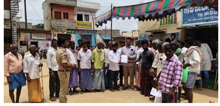
అక్షర విజేత, ఇబ్రహీంపట్నం :-