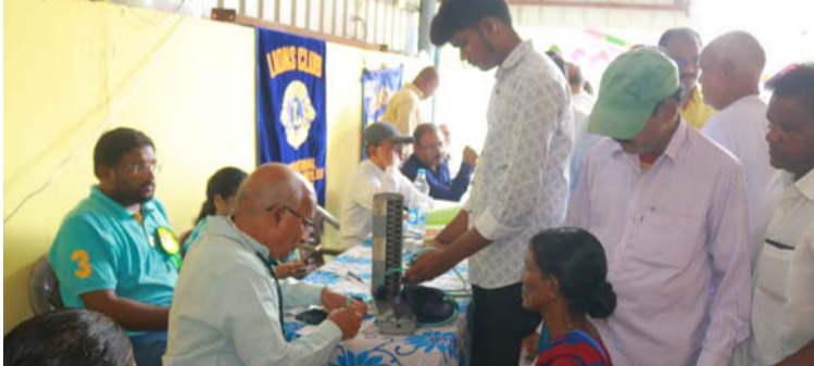
అక్షర విజేత రామకృష్ణపూర్