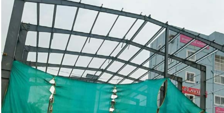
అక్షర విజేత రాజేంద్రనగర్

రాజేంద్రనగర్ సర్కిల్ పరిధిలోని ఆత్మాపూర్ డివిజన్ పరిధి మూసి పరిమాణక ప్రాంతంలో అనుమతులను తుంగలో తొక్కుతూ, బఫర్ జోన్ ప్రాంతంలో భారీ షెడ్డు నిర్మాణం జరుగుతుంది. ఈ షెడ్డుకు రాజేంద్రనగర్ జీహెచ్ఎస్సీ నుండి అనుమతులు తప్పని సరి. అయితే అనుమతులను తీసుకోకుండానే సదరు వ్యక్తి భారీ షెడ్డు నిర్మాణానికి తీర లేపడం జరిగిందని స్థానికులు అంటున్నారు. ఈ ప్రాంతం బఫర్ జోన్ లోకి వస్తుందని, గతంలో హైద్రా పలు చోట్ల మార్కెట్ కూడ చేసి, నోటీసులను సైతం అందజేసినదని స్థానికులు గుర్తు చేశారు. ఇప్పటికైనా ఈ అక్రమ షెడ్డు పై తక్షణమే చర్యలు తీసుకుని నెలమట్టం చేయాలని స్థానిక ప్రజలు డిమాండ్ చేస్తున్నారు.