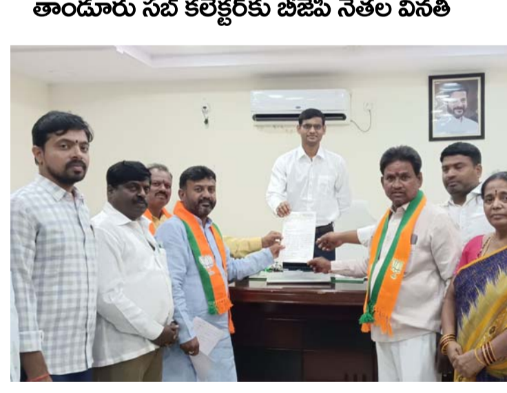
అక్షర విజేత, తాండూరు