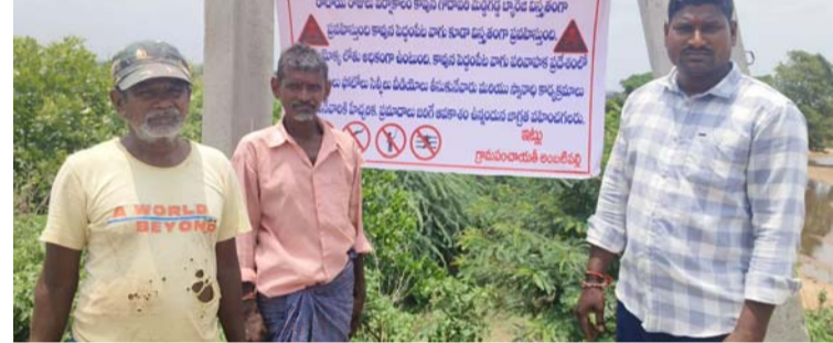
అక్షర విజేత, మహాదేవపూర్:

మేడిగడ్డ బ్యారేజ్ పెద్దంపేట వాగు వద్ద ప్రమాద హెచ్చరిక ఫైక్సీలు ఏర్పాటు. గోదావరిలో ఆరుగురు యువకుల మరణంతో అప్రమత్తం.