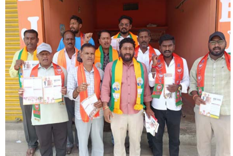
అక్షర విజేత, చందుర్తి / రాజన్న సిరిసిల్ల ప్రతినిధి :