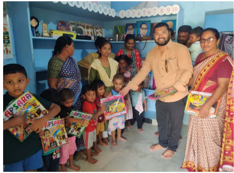
అక్షర విజేత సూర్యాపేట ప్రతినిధి