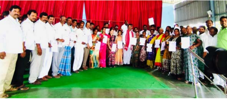
అక్షర విజేత, ఇల్లహింపట్లం :-