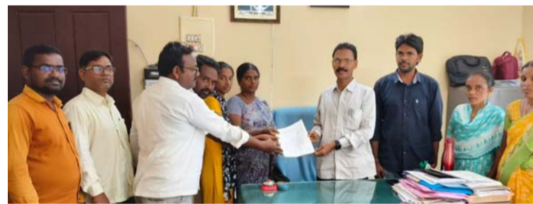
అక్షర విజేత నర్సింహాలపేట