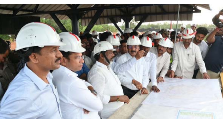
కార్మికులు, అధికారులకు అవగాహన కల్పించాలని డిప్యూటీ సీఎం సూచించారు. ఇదంతా ఒక భాగమైతే మైనింగ్ రంగంలో 136 సంవత్సరాల అనుభవం ఉన్న సింగరేణి కంపెనీ బొగ్గుతోపాటు ఇతర మైనింగ్ కార్యకలాపాలపై దృష్టి పెట్టి లాభాలు ఆర్జించే ఆలోచన చేయాలని డిప్యూటీ సీఎం తెలిపారు. ప్రపంచంలో ఉన్న క్రీటివ్ మినరల్స్ ఏమిటి, వాటికి ఉన్న డిమాండ్ ఎంత అన్న అంశాలపై అధ్యయనం చేసేందుకు కన్సల్టెంట్ ను నియమించుకోవాలని డిప్యూటీ సీఎం సూచించారు. భవిష్యత్తు గురించి ఆలోచన చేయకపోతే ముందు తరాలకు నష్టం చేసినట్లు అవుతుందని డిప్యూటీ సీఎం అభిప్రాయం వ్యక్తం చేశారు. సింగరేణిలో పూర్తిగా వ్యాపారమే కాదు మానవీయ కోణం కూడా ఉండాలని తెలిపారు. సింగరేణి మైన్ కార్యకలాపాలు జరిగే ప్రాంతం మొత్తం వరకు అక్కడి ప్రజల సంక్షేమాన్ని దృష్టిలో

ప్రభుత్వానికి మేలు జరగాలన్నది ప్రభుత్వ ప్రధాన ఆలోచన అని డిప్యూటీ సీఎం తెలిపారు. గతంలో బొగ్గు రంగంలో సింగరేణి, కోల్ ఇండియా లది ఏకచక్రాధిపత్యం కానీ ఇటీవల ప్రపంచ వ్యాప్తంగా బొగ్గు రంగంలో వచ్చిన మార్పుల నేపథ్యంలో మార్కెట్లో పోటీకి తట్టుకొని సింగరేణి నిలబడాల్సిన అవసరం ఉందని డిప్యూటీ సీఎం అభిప్రాయపడ్డారు. మైనేట్ కంపెనీల బొగ్గు ఉత్పత్తి వ్యయం, ఆ కంపెనీలు బహిరంగ మార్కెట్లో బొగ్గు ఏ ధరకామ్ముతున్నాయి, సింగరేణిలో బొగ్గు ఉత్పత్తి వ్యయం, బహిరంగ మార్కెట్లో సింగరేణి బొగ్గుకు ఉన్న ధర ఎప్పుటికప్పుడు అధికారులు, సిబ్బంది పోల్చుకోవాలని డిప్యూటీ సీఎం సూచించారు. ఈ ఉత్పత్తి వ్యయం, మార్కెట్లో బొగ్గు ధరలకు సంబంధించిన వివరాలను సింగరేణి కార్మికులకు అవగాహన కలిగేలా మైన్స్ వద్ద బోర్డులు ఏర్పాటు చేయాలని, సింగరేణి