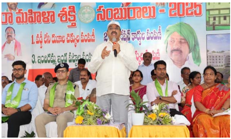
అక్షర విశేష ఖమ్మం -