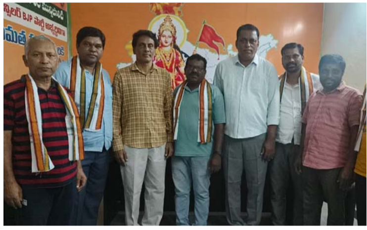
అక్షర విజేత, కీసర్ నాగారం: