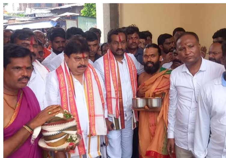
అక్షర విజేత, పాపన్నపేట