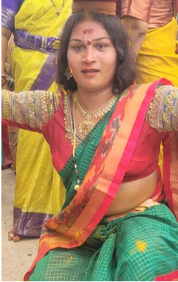
అక్షర విజేత, కీసర్ నాగారం: