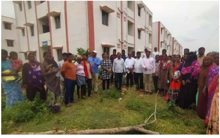
అక్షర విజేత, ఇల్లపాపట్లం :-

డబుల్ బెడ్ రూమ్లను పరిశీలించిన విద్యుత్ సివిల్ ఇంజనీర్ అధికారులు.