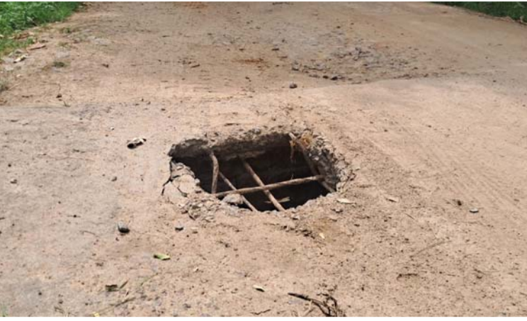
అక్షర విజేత బిమ్మండ

కామారెడ్డి జిల్లా బిమ్మండ మండల కేంద్రం నుండి తక్కువ పల్లె గ్రామానికి వెళ్లే దారిలో గిద్ద చెరువు వద్ద రోడ్డుపై కల్వర్లుకు మధ్యలో భారీ గుంత ఏర్పడింది. ఈ రోడ్డు ద్వారానే వాహనాల రాకపోకలు సాగుతుంటాయి. గుంత వల్ల ప్రమాదం జరిగే అవకాశం ఉందని ప్రయాణికులు భయాందోళనలకు గురి చెందుతున్నారు. గత కొన్ని నెలలుగా గుంత అలాగే ఉన్న అధికారులు పట్టించుకోవడం లేదని వారు తెలిపారు. ఎలాంటి ప్రమాదం జరగకముందే అధికారులు స్పందించి గుంతను పూడ్చేలా చర్యలు తీసుకోవాలని ప్రయాణికులు కోరుతున్నారు.