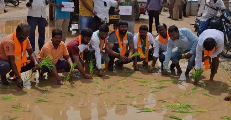
అక్షర విజేత, ఇబ్రహీంపట్నం :-

ఎమ్మెల్యే దిట్టి బొమ్మ దహనం చేసి వినూతన నిరసన.