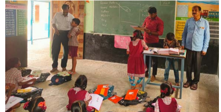
అక్షర విజేత, కిసంపేట.