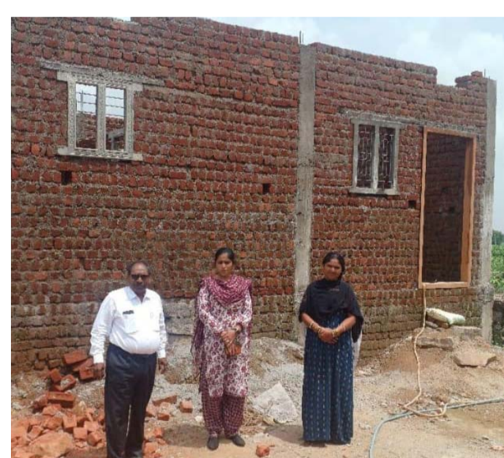
అక్షర విజేత, మోర్లాడ్ :