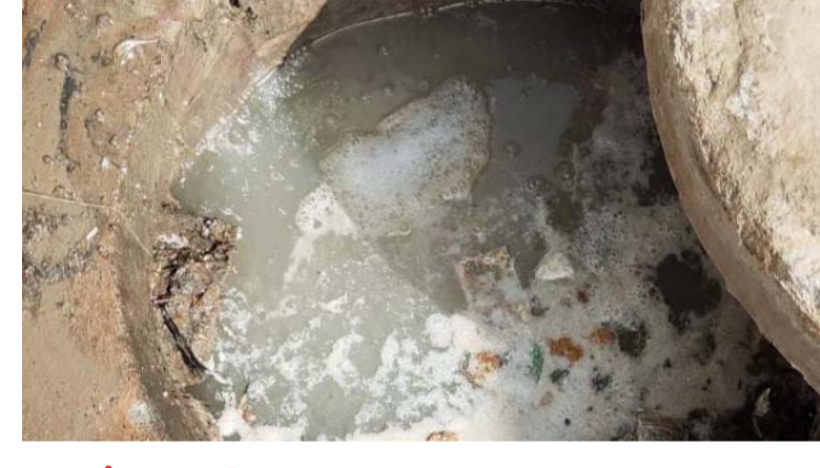
అక్షర విజేత, దుండిగల్ :

దుండిగల్ మున్సిపాలిటీ లోని దుండిగల్ తండా టూలో మురుగునీటి పొంగిపొర్లుతో స్థానికులు తీవ్ర అసౌకర్యానికి గురవుతున్నారు. వీధిలో మురుగు లైన్లు ఓవర్‌ఫ్లో కావడంతో డ్రైనేజీ నీరు రోడ్డుపైకి చేరింది. దీంతో రోడ్డు నీటితో నిండిపోగా పాదచారులకు తీవ్ర ఇబ్బందులు ఎదురవుతున్నాయి. పరికాలంలో ఈ మురుగునీటి నిలువలతో దోమల ఉత్పత్తి పెరిగే అవకాశముండడంతో ప్రజల్లో ఆందోళన నెలకొంది. పిల్లలు, వృద్ధులు ఆరోగ్య సమస్యలు ఎదుర్కొనే ప్రమాదం ఉంది. స్థానికులు పలుమార్లు సంబంధిత మున్సిపల్ అధికారులకు ఫిర్యాదులు చేసినప్పటికీ ఇప్పటివరకు ఎలాంటి చర్యలు తీసుకోకపోవడం బాధాకరం. స్థానికులు సంబంధించిన అధికారులు వెంటనే డ్రైనేజీ సమస్యను పరిష్కరించాలని మున్సిపల్ అధికారులను డిమాండ్ చేస్తున్నారు. అధికారుల నిర్లక్ష్యంపై తీవ్ర అసంతృప్తిని వ్యక్తం చేస్తున్నారు.