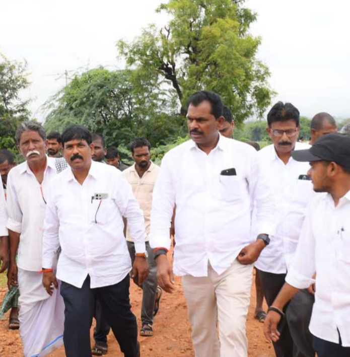
అక్షర విజేత పనపర్తి ప్రతినిధి.

ఏదుల- రేవల్లి రోడ్డును పరిశీలించిన ఎమ్మెల్యే