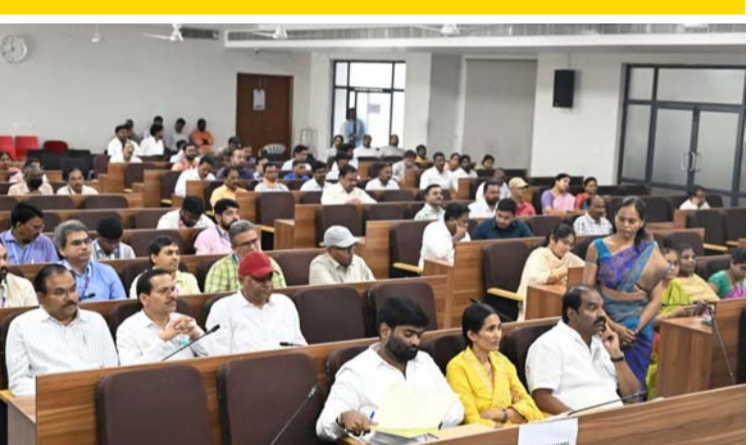
అక్షర విజేత, ఇబ్రహీంపట్నం :-