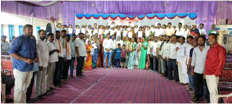
అక్షర విజేత, రాయకల్ :

ప్రతి పథకం కాంగ్రెస్ ప్రభుత్వం అమలు చేసింది మాజీ మంత్రి జీవన్ రెడ్డి