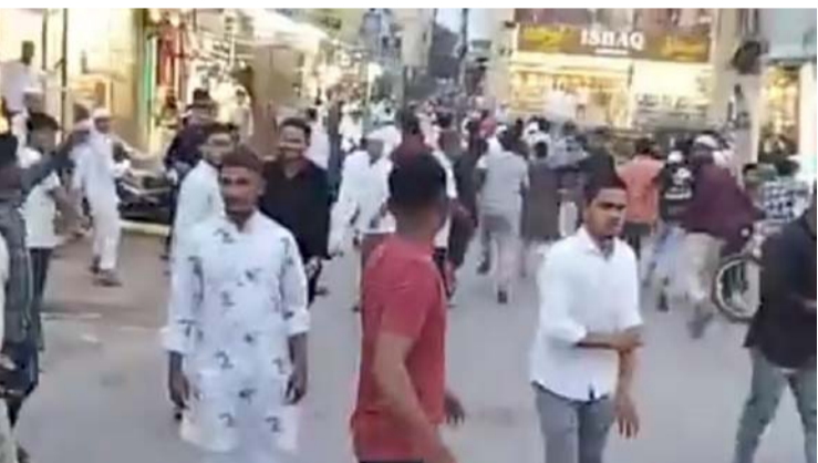
అక్షర విజేత, నిజామాబాద్ ప్రసాద్ :

అక్రమణలను తొలగిస్తున్న పోలీసుల విధులకు అటంకం ఎంఐఎం నాయకులు, ట్రాఫిక్ పోలీసుల పుణ్య తీర్థ వాగ్వివాదం