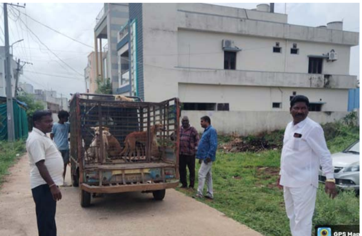
Khammam, Telangana, India 65g3+q53, Sambhani Nagar, Mustafa Nagar, Khammam, Telangana 507002, India