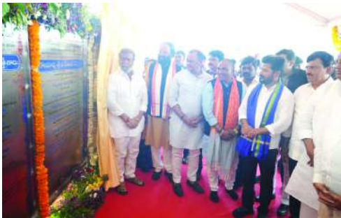
యాదగిరిగుట్ట, జూన్ 6 (తెలుగురేఖ): గంధమల్ల రిజర్వాయర్నును గత బిఆర్ఎస్ ప్రభుత్వం ఎందుకు పూర్తిచేయలేకపోయిందని సిఎం రేవంత్ రెడ్డి ప్రశ్నించారు.

పలు అభివృద్ధి పనులకు సిఎం రేవంత్ శంకుస్థాపన