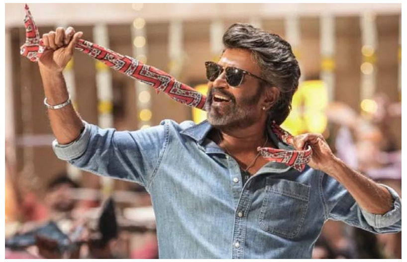
టీమ్ అమెజాన్ డెలివరీ బాక్సులపై మూవీ పోస్టర్లను ముద్రించి అందరి దృష్టిని ఆకర్షిస్తోంది. అమెజాన్ డెలివరీ బాక్సులపై 'కూలీ' పోస్టర్లను చూసిన నెటిజన్లు ఆశ్చర్యపోతున్నారు. ఇలాంటి యూనిక్ ఐడియా అసలు మీకు ఎలా వచ్చింది, వాట్ యాన్ ఐడియా నరేజీ.. అంటూ పొగడలతో ముంచెత్తుతున్నారు. అమెజాన్ బాక్సులను ఐడియాల తీసి వాటిని సోషల్మీడియాలో పోస్టు చేస్తున్నారు. అసలు ఇలాంటి ఐడియా వచ్చినందుకు మెచ్చుకోకుండా ఉండలేకపోతున్నామంటున్నారు.

సాధారణ ప్రమోషన్లకు భిన్నంగా 'కూలీ' సినిమా టీం తీసుకున్న విస్తృత పుష్కలం ఇప్పుడు సంవలనంగా మారింది. అమెజాన్ డెలివరీ బాక్సులపై రజనీకాంత్ లుక్తో కూడిన పోస్టర్లను ముద్రించడం ద్వారా ప్రేక్షకుల దృష్టిని ఆకర్షించింది. ఈ క్రియేటివ్ ఐడియాపై నెటిజన్ల ప్రశంసలు వెల్లువెత్తుతున్నాయి. ఈ ఐడియాతో సినిమాపై క్రేజ్ రెడ్డింపు అయింది. 'కూలీ' ఆగస్టు 14న పాన్ ఇండియా స్థాయిలో విడుదల కానుంది. ఈ యూనిక్ ప్రమోషన్ల మూవీ హైట్స్ మరొక పెంచించి, సూపర్ హిట్ రజనీకాంత్, లోకేష్ కనగరాజ్ అంచనాలున్నాయి. సనీ విక్రమ్ నంద్యాల రూ. 350 కోట్ల బడ్జెట్తో నిర్మిస్తోన్న ఈ చిత్రంలో అక్కినేని నాగార్జున, ప్రతిపాటి, సత్యరాజ్, అమీర్ఖాన్, ఉపేంద్ర, సౌబినీ షాహిన్ వంటి స్టార్లను నటిస్తున్నారు. లోకేష్ కనగరాజ్ సినిమాలుంటే హై ఓట్లతో యాక్షన్ సిక్వెన్స్ ప్రసిద్ధి. 'కూలీ'లో అంతకుమించి ఉంటాయని యూనిట్ చెబుతోంది. ఆగస్టు 14న ఈ మూవీ ప్రపంచవ్యాప్తంగా రిలీజ్ కానుంది. ఇప్పటికే రిలీజ్ చేసిన ఫస్ట్ లుక్స్, గ్లింప్స్, టీజర్ అంచనాలను మరొక పెంచేశాయి. ఇటీవల వదిలిన 'మోనికా' సాంగ్ ఇంటర్నెట్లో ఊపిరిపోసింది. ఇక శనివారం (ఆగస్టు 2) నాడు ట్రైల్ రిలీజ్ చేయనున్నట్లు మేకర్స్ ప్రకటించడంతో సినీ ప్రయులు ఆసక్తిగా ఎదురుచూస్తున్నారు. ఆగస్టు 14న 'కూలీ' చిత్రానికి పోటీగా 'వారీ 2' కూడా రిలీజ్ కానుంది. ఈ నేపథ్యంలోనే రెండు పెద్ద చిత్రాల ప్రమోషన్లలో పోటీపడుతున్నాయి. అయితే 'కూలీ' టీమ్ చేసిన ఓ ప్రయోగం ఇప్పుడు నెట్టింట్ల వైరల్ అవుతోంది. సరికొత్త పూహంతో బరిలోకి దిగిన 'కూలీ'