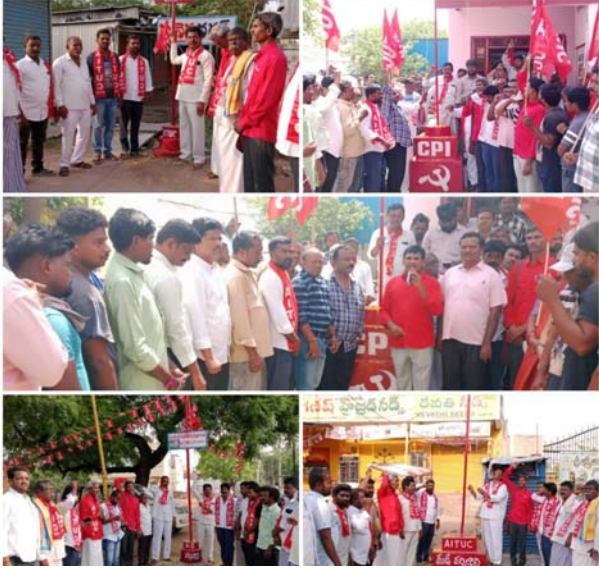
ప్రాంతాలలో AITUC అరుణ పతాకాన్ని ఎగిరివేయడం జరిగింది జరిగింది.

ఎమ్మిగనూరు మే 10 గురువారం 2, ట్రాక్టర్ అమావి వరల్డ్ యూనియన్ 3, ఆర్డీసీ ఎంప్లాయిస్ యూనియన్ 4, నాగప్పల కట్ట ఆటో వరల్డ్ యూనియన్, 5, పెద్ద బావి ఆటో వరల్డ్ యూనియన్, 6, సోమేశ్వర టాక్స్ ఆటో వరల్డ్ యూనియన్, 7, మున్నెప్ప నగర్ ఆటో వరల్డ్ యూనియన్ 8, స్పిన్లింగ్ మిల్ వరల్డ్ యూనియన్, 9, సివిల్ సప్లయ్ గోడౌన్ హామలి వరల్డ్ యూనియన్ 10, మున్సిపల్ వరల్డ్ యూనియన్ 11 మున్సిపల్ వరల్డ్ యూనియన్ క్వార్టర్-112, డిగాల్ గేట్ హామలి వరల్డ్ యూనియన్ తదితర