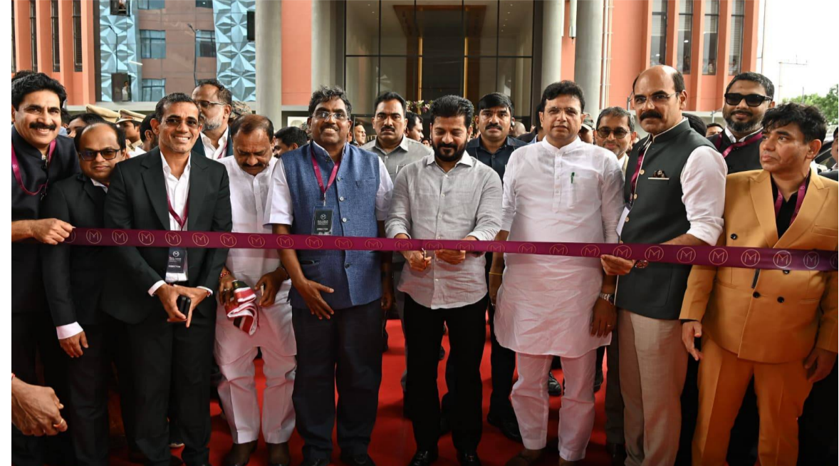
బంగారం వ్యాపారం మంచి పేరున్న మలబార్ గోల్డ్ తన యూనిట్ ను తెలంగాణలో ప్రారంభించడం సంతోషకర పరిణామమని సరైన ప్రాంతంలో, సరైన రాష్ట్రంలో మలబార్ గోల్డ్ తన యూనిట్ ను ప్రారంభించింది అన్నారు. ఈ

విధానాలు అమలులో ఉన్నాయని, వాటిని మరింత మెరుగైన విధానంలో తమ ప్రభుత్వం అమలు చేస్తోందన్నారు. తెలంగాణ రాష్ట్రంలో హైదరాబాద్ ను ఒక వ్యాపార నగరంగా తీర్చిదిద్దాలన్న సంకల్పంతో పనిచేస్తున్నాం. మహేశ్వరం ప్రాంతంలో నాలుగో నగరంగా భారత్ ఫ్యూచర్ సిటీని ప్రపంచానికి అందించబోతున్నాం. 30 వేల ఎకరాల్లో ప్రపంచంలోనే అధునాతన నగరాన్ని నిర్మించబోతున్నామన్నారు. ప్రపంచ దేశాలతో పోటీ పడే నైపుణ్యం ఇక్కడి యువతలో ఉంది. హైదరాబాద్ ప్రపంచంతో పోటీ పడగలదు. అందుకే ముంబాయి, బెంగుళూరు చెన్నై వంటి నగరాలతో కాకుండా ప్రపంచ అగ్రశ్రేణి నగరాలతో పోటీ పడాలని లక్ష్యంగా నిర్దేశించామని వెల్లడించారు. రాజీవు వందేళ్ల వరకు రాష్ట్రానికి ఏమవసరమో భవిష్యత్ ప్రణాళికలతో రూపొందిస్తున్న తెలంగాణ రైజింగ్ 2047 విజన్ దాక్యుమెంట్ ను వచ్చే డిసెంబర్ 9 న ఆవిష్కరిస్తున్నాం. అధునాతన భారత్ ఫ్యూచర్ సిటీ నిర్మాణానికి సంబంధించిన ప్రణాళికలపై సింగపూర్, ఇతర దేశాల కన్సల్టెంట్లు నిరంతరం పని చేస్తున్నారు. ఐటీ, ఫార్మా రంగాల్లో తెలంగాణ దేశంలోనే లెజెండ్ గా నిలిచింది. దేశంలో 35 శాతం బిల్వో డ్రగ్ హైదరాబాద్ నుంచే ఉత్పత్తి అవుతోంది. ఇలాంటి ప్రాంతం నుంచి మలబార్ బంగారం యూనిట్ ప్రారంభించడంతో ఇక బంగారంలోనూ తెలంగాణ ప్రసిద్ధి చెందుతుందని తెలిపారు.