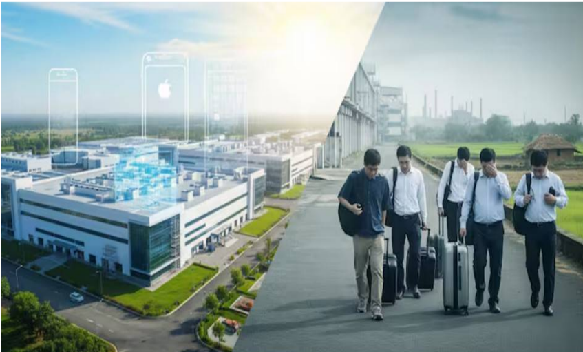
సాంకేతిక పరిజ్ఞానాన్ని చైనా నుంచి బదిలీ చేసే ప్రక్రియ నెమ్మదించవచ్చని నిపుణులు భావిస్తున్నారు. దీనివల్ల ఉత్పత్తి వ్యయం పెరిగే ప్రమాదం ఉందని వారు అంచనా వేస్తున్నారు. "ఈ నిర్ణయం వల్ల భారత్ లో ఉత్పత్తి నాణ్యతపై ప్రభావం పడకపోవచ్చు, కానీ అసెంబ్లీ లైన్ లో సామర్థ్యం కచ్చితంగా తగ్గుతుంది" అని ఈ వ్యవహారంతో సంబంధం ఉన్న ఒకరు చెప్పినట్లు నివేదిక పేర్కొంది

తరలించడాన్ని నిరుత్సాహపరిచేందుకు చైనా ప్రభుత్వం ప్రయత్నిస్తున్న తరుణంలో ఈ పరిణామం చోటుచేసుకోవడం ప్రాధాన్యత సంపదించుకుంది. అమెరికా-చైనా మధ్య ఉద్రిక్తతల నేపథ్యంలో తయారీ కంపెనీలు చైనా నుంచి బయటకు తరలిపోకుండా అడ్డుకునే వ్యూహంలో ఇది భాగం కావచ్చని కథనాలు వస్తున్నాయి. ప్రస్తుతం యాపిల్ ఏటా తయారుచేసే ఐఫోన్లలో సుమారు 15 శాతం (40 మిలియన్ యూనిట్లు) భారత్ లో ఉత్పత్తి అవుతున్నాయి. త్వరలో విడుదల కానున్న ఐఫోన్ 17 ఉత్పత్తిని భారత్ లో భారీగా పెంచాలని యాపిల్ భావిస్తోంది. ఇలాంటి కీలక సమయంలో చైనా నిపుణులు వెనుదిరగడం ఉత్పత్తి సామర్థ్యంపై ప్రభావం చూపవచ్చని నిపుణులు అంచనా వేస్తున్నారు. చైనా సిబ్బందిని వెనక్కి పిలవడం వల్ల స్థానిక కార్మికులకు శిక్షణ ఇవ్వడం, తయారీ