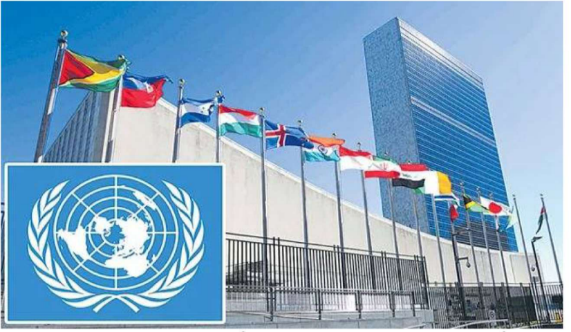
అత్యంత తీవ్రంగా మారాయని, వాణిజ్య ఉద్దికృతలతో ఈ పరిస్థితి మరింత దారుణంగా తయారైందని నివేదిక పేర్కొంది. దీనివల్ల రుణ సంక్షోభం పెచ్చరిల్లుతుందని, నిరుద్యోగతరంగాలు పెరుగుతుందని పేర్కొంది.