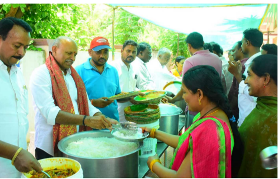
మిర్యాలగూడ పట్టణం మరియు పరిసర గ్రామాల నుండి విద్యార్థులు ఈ అవకాశాన్ని వినియోగించుకోవడం చాలా