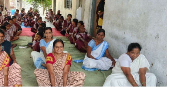
ఆసనం, సూర్య సమస్కారంలు చక్రాసనం, మొదలగు ఆసనాలు, ప్రాణాయామం, ధ్యానం చేయించడం