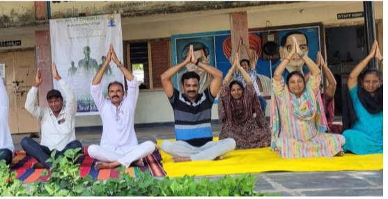
జరిగిన కార్యక్రమంలో వారు మాట్లాడుతూ యోగ సాధన తో విద్యార్థులలో సమూల మార్పు తీసుకురావచ్చని, వారిని ఉన్నత పౌరులుగా తీర్చిదిద్దవచ్చని అన్నారు. ఈ

విద్యార్థులు నిత్యం యోగ సాధన చేయడం ద్వారా వారిలో పరివర్తన కలుగుతుందని జిల్లా పరిషత్ ఉన్నత పాఠశాల మరియు ప్రధానో పాఠశాలలు అనంతరా వు అన్నారు. అంతర్జాతీయ యోగా దినోత్సవం సందర్భంగా పాఠశాలలో విద్యార్థుల చేత యోగాభ్యాసాలు, ప్రాణాయామాలు చేయించడం జరిగింది. ఈ సందర్భంగా