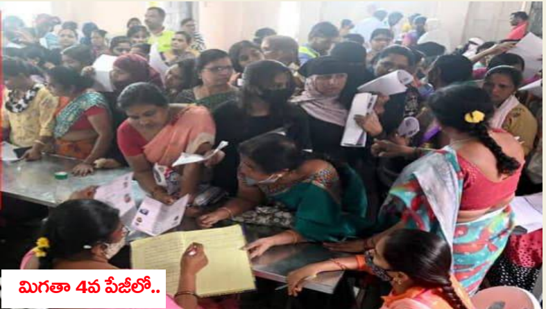
మిగతా 4వ పేజీలో..

జిల్లాలో భూభారతి రెవెన్యూ సదస్సుల ద్వారా వచ్చిన దరఖాస్తులతో తాసిల్దారులకు, రెవెన్యూ ఇన్స్పెక్టర్లకు తలనొప్పిగా మారింది. ఈనెల 3 నుండి ప్రారంభమైన రెవెన్యూ సదస్సుల ద్వారా జిల్లా వ్యాప్తంగా 42,534 దరఖాస్తులు వచ్చాయి. అదేవిధంగా జిల్లా వ్యాప్తంగా మిస్సింగ్ సర్వే నెంబర్లు 14803 జిల్లా కలెక్టర్ కార్యాలయానికి చేరాయి. దీంతో తహసీల్దారు, రెవెన్యూ ఇన్స్పెక్టర్లు దరఖా