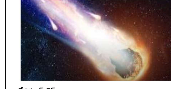
వేద న్యూస్, డెన్యూ:

మన సౌర కుటుంబంలో భూమికి పొరుగున ఉన్న శుక్ర గ్రహం సమీపంలో కొన్ని ప్రమాదకర గ్రహాశకలాలు పరిభ్రమిస్తున్నాయని, అవి మన గ్రహానికి తీవ్ర ముప్పు తెచ్చిపెట్టగలవని శాస్త్రవేత్తలు తీవ్ర ఆందోళన వ్యక్తం చేస్తున్నారు. సూర్యుడి ప్రచండమైన కాంతి వల్ల, భూమి నుంచి చూసినప్పుడు శుక్ర గ్రహం అడ్డుగా ఉండటం వల్ల ఈ 'అద్భుత శత్రువుల'ను గుర్తించడం అత్యంత కష్టతరంగా మారినది వారు విశ్లేషిస్తున్నారు. ఈ గ్రహాశకలాలు, శుక్ర గ్రహం పాటు సూర్యుని చుట్టూ తిరుగుతున్నప్పటికీ, వాటి కక్ష్యలు అస్థిరంగా ఉండటం ప్రధాన సమస్య. ఈ అస్థిరత్వం కారణంగా, అవి తమ మార్గాన్ని మార్చుకుని అనాహంగా భూమి కక్ష్య వైపు దూసుకువచ్చే ప్రమాదం పొంచి ఉంది. వీటిలో కొన్ని భారీ గ్రహాశకలాలు (అస్టెరాయిడ్లు) భూమిని ఢీకొంటే, పెద్ద నగరాలు సైతం ధ్వంసమయ్యేంత వినాశకరం సంభవించవచ్చని నిపుణులు హెచ్చరిస్తున్నారు. భూమికి అత్యంత సమీపానికి వచ్చిన తర్వాత వీటిని గుర్తించే అవకాశం ఉండటం పరిస్థితి తీవ్రతకు అడ్డం పడుతోంది.