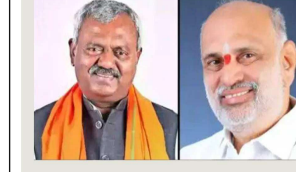
వేద న్యూస్, బెంగళూరు: