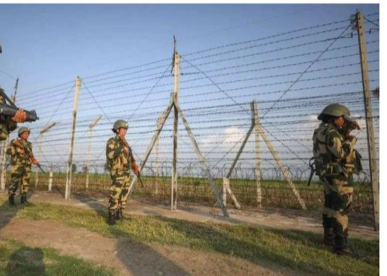
లేదా అంతర్జాతీయ సరిహద్దు కావచ్చు మన భద్రతా దళాలు అన్ని ప్రాంతాల్లో పూర్తి అప్రమత్తంగా ఉండాల్సి అవసరం ఉందని అయిన చెప్పారు. ఆపరేషన్ సిందూర్ సందర్భంగా మన సాయుధ దళాలు ఉగ్రవాదులకు చెందిన కచ్చితమైన లక్ష్యాలు జరిపిన దాడుల్లో దాదాపు వంద మంది ఉగ్రవాదులు హతమైన విషయం తెలిసింది. ఇదిలా ఉండగా గత నెల 10న ఉగ్రవాదుల చేతిలో ముగ్గురు భద్రతా జవాన్లు మృతి చెందినందుకు గుర్తుగా సాహా సెక్టర్ లో ఒక పోస్టుకు 'సిందూర్' పేరు పెట్టాలని బిఎస్ఎఫ్ ప్రకటించింది. అలాగే ఆ ఘటనలో మృత్యుచెందిన ఇద్దరు జవాన్ల పేర్లను మరో రెండు పోస్టులకు పెట్టాలని కూడా నిర్ణయించింది.