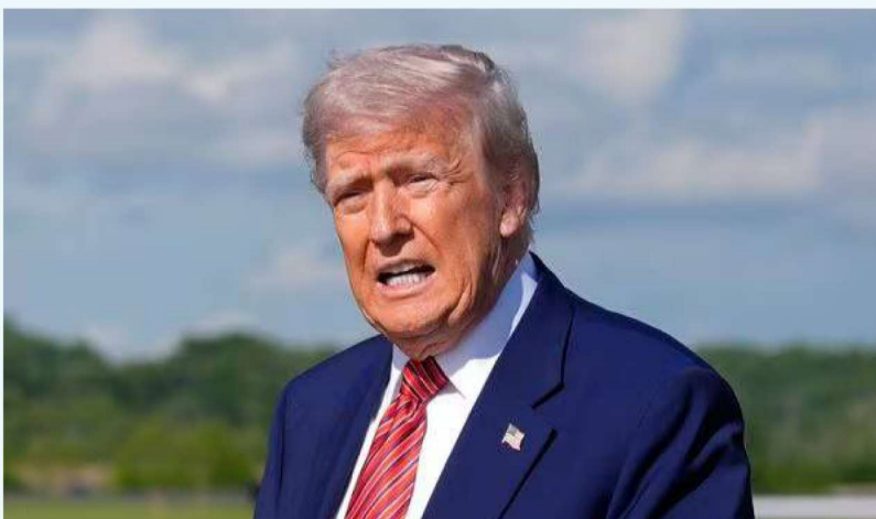
దేశాలతో జరుపుతున్న చర్చల ప్రక్రియపై అనిశ్చితి ఏర్పడుతుంది.

తెలిపింది. సుంకాల విషయంలో అధ్యక్షుడు తన విశేషాధికారాన్ని ఉపయోగించుకోవడాన్ని చట్టం అనుమతించదని ముగ్గురు న్యాయమూర్తులతో ఏర్పడిన ప్యానల్ స్పష్టం చేసింది. దేశాధ్యక్షుడికి ఉన్న పరిజ్ఞానం, సమర్థతపై తామేమీ వ్యాఖ్యానించబో మని, అయితే చట్టం అనుమతించనందున వాటిని ఉపయోగించుకోవడాన్ని అనుమతించలేమని తెలిపింది. ఈ తీర్పు అమలులోకి వచ్చిన పక్షంలో.. వాణిజ్య భాగస్వాముల నుండి రాయితీలు పొందడా నికీ సుంకాలు విధించాలన్న ట్రంప్ అంతర్జాతీయ వాణిజ్య వ్యూహం బెడిసికొడుతుంది. యూరోపియన్ యూనియన్, చైనా, ఇతర