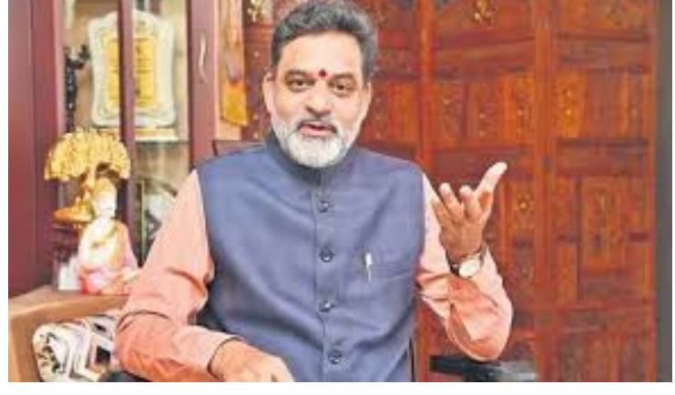
రాష్ట్రపతి అభిప్రాయ విజ్ఞాపన రాజ్యాంగ ప్రక్రియలో భాగం...