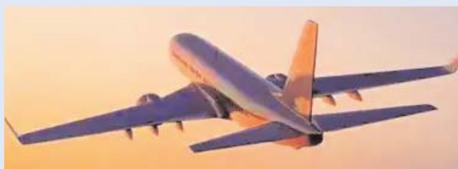
న్యూఢిల్లీ,మే9 (తెలుగు రేఖ):

● జూన్ 13న ప్రారంభిస్తున్న టెలూజ్ ఎయిర్ లైన్స్