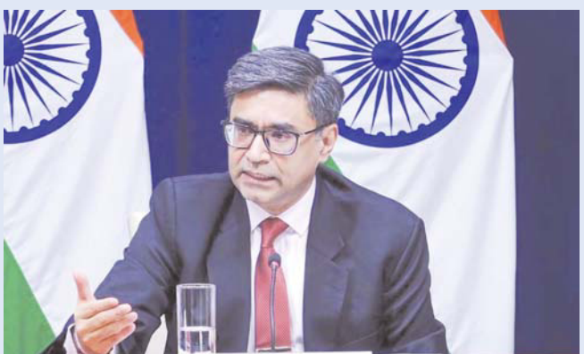
న్యూఢిల్లీ,మే9 (తెలుగు రేఖ):