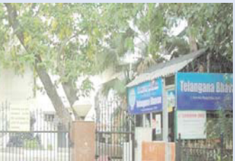
హైదరాబాద్,మే9 (తెలుగు రేఖ):

భారత్-పాకిస్తాన్ సరిహద్దుల్లో ఉద్రిక్తతల దృష్ట్యా దిల్లీలోని తెలంగాణ భవన్ లో కంట్రోల్ రూమ్ ఏర్పాటు చేశారు. ఎపి కూడా ఇదే తరహాలో కంట్రోల్ రూమ్ ఏర్పాటు చేసింది. సరిహద్దు రాష్ట్రాల్లో ఉంటున్న లేదా చిక్క కన్న తెలంగాణ వాసులకు సాయం చేసేందుకు, సమాచారం ఇచ్చేందుకు, వారికి అవసరమైన సేవలు అందించేందుకు ఈ కంట్రోల్ రూమ్ ను ఏర్పాటు చేశారు. ఎలాంటి సాయం కావాలన్నా కంట్రోల్ రూమ్ నంబర్ 011-23380556ను సంప్రదించాలని సూచించారు. కంట్రోల్ రూమ్ నంబర్ పాటు- రెసిడెంట్ కమిషనర్ ప్రైవేటు- సెక్రటరీ, లైజన్ హెడ్ నంబర్ 98719-99044, రెసిడెంట్ కమిషనర్ పబ్లిక్ గత సహాయకుడి నంబర్ 99713-87500, తెలంగాణ భవన్ లో లైజన్ ఆఫీసర్ నంబర్ 96437-23157, పబ్లిక్ రిలేషన్ ఆఫీసర్ నంబర్ 99493-51270ను సంప్రదించాలని అధికారులు ఓ ప్రకటనలో పేర్కొన్నారు.