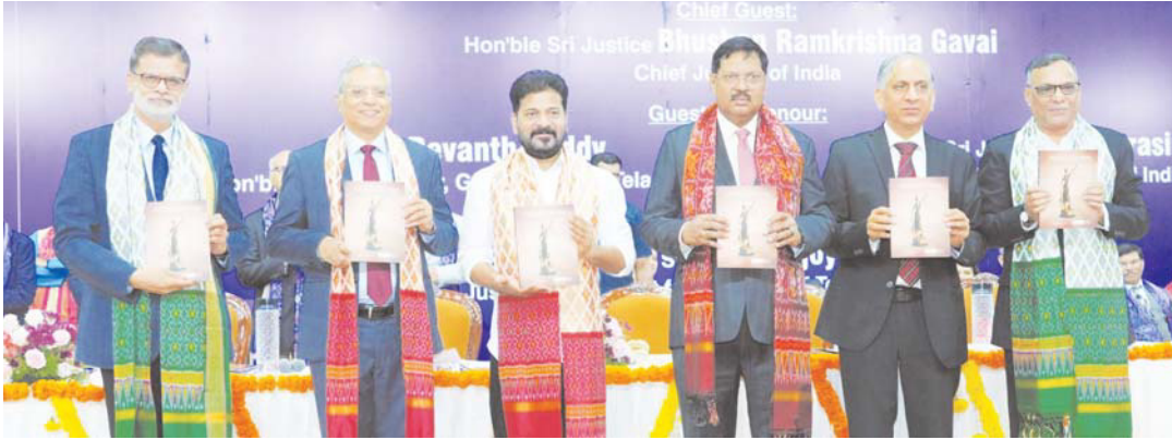
ప్రస్తుతం న్యాయవ్యవస్థలో ఎన్నో సవాళ్లు ఉన్నాయి. కొన్ని కేసుల విచారణ దశాబ్దాల పాటు సాగటం ఆందోళనకరం అని పేర్కొన్నారు. హైదరాబాద్ లోని నల్సార్ లా యూనివర్సిటీలో 22వ స్నాతకోత్సవం శనివారం ఘనంగా జరిగింది. హైదరాబాద్ నల్సార్ యూనివర్సిటీ స్నాతకోత్సవ కార్యక్రమానికి జస్టిస్ బీఆర్ గవాయ్, తెలంగాణ