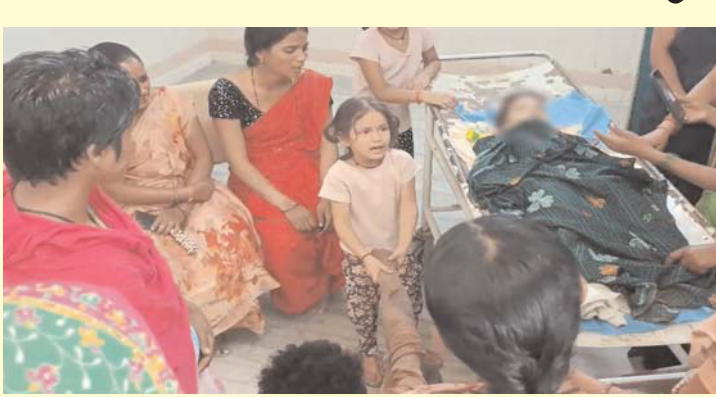
హైదరాబాద్, జూలై 12(తెలుగు రేఖ):

హైదరాబాద్ మీయాపూర్ లో వివాదం చోటుచేసుకుంది. ప్రమాదపశాత్తు నాలుగేళ్ల బాలుడు నీటి సంపులో పడి మృతి చెందాడు. పోలీసుల వివరాల ప్రకారం.. మీయాపూర్ లోని హఫీజ్‌పేట్ మరాఠీ నగర్ కాలనీలో తీసు, నీల దంపతుల నాలుగేళ్ల కుమారుడు అభి ఇంటి పరిసరాల్లో ఆడుకుంటూ ప్రమాదపశాత్తు జూలై 12న నీటి సంపులో పడి మృతి చెందాడు. కూలి పనుల కోసం ఉదయాన్నే ఇంటి నుంచి వెళ్లిన తల్లిదండ్రులు తమ కుమారుడి మరణ వార్త విని కన్నీరుమున్నీరుగా విలపిస్తున్నారు. ఇంటి యజమాన్యం నిర్లక్ష్యం వల్లే తమ కుమారుడు ప్రాణాలు కోల్పోయాడని కుటుంబ సభ్యులు ఆవేదన వ్యక్తం చేస్తున్నారు. ఘటనా స్థలానికి చేరుకున్న మీయాపూర్ పోలీసులు కేసు నమోదు చేసుకుని దర్యాప్తు చేస్తున్నారు. చిన్నపిల్లలు ఇంటి దగ్గర ఉన్నప్పుడు తల్లిదండ్రులు వారిని నిత్యం గమనిస్తూ ఉండండి. లేదంటే ఇలాంటి అనుకోని సంఘటనల తర్వాత బాధపడాల్సి వస్తుందని హెచ్చరించారు.