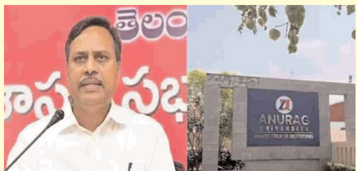
మేఘల్, జూలై 12(తెలుగు రేఖ):