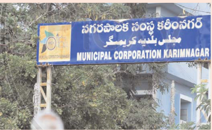
కరీంనగర్, జూన్ 4, (తెలుగు రేఖ)