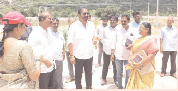
తిరుపతి, జూన్ 4, (తెలుగు రేఖ)