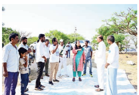
- కొనుగోలు కేంద్రాలపై కలెక్టర్ ప్రతిమా సింగ్ ఆకస్మిక తనిఖీ - రవాణా, అన్వేషింగ్ లో జాప్యం లేకుండా పటిష్ట చర్యలు - "రైతులకు ఎలాంటి ఇబ్బందులు రాకూడదు" - జిల్లా యంత్రాంగానికి కలెక్టర్ ఆదేశాలు