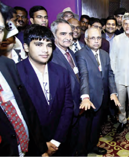
వాహనాలు, వికేంద్రీకర్త ఇందన వ్యవస్థలో భవిష్యత్ అవసరాలని పేర్కొన్నారు. ఏపీలో ఇప్పటికే “టెక్నోపార్క్ పాలసీ” అమలు చేస్తున్నామని, సోలార్

పరిశ్రమ, పాలం విద్యుత్ ఉత్పత్తి కేంద్రాలుగా మారాలి అవసరం ఉందని చంద్రబాబు అభిప్రాయ పడ్డారు. గ్రీన్ ఎనర్జీ, బయోగ్యాస్, ఇథనాల్, ఎలక్ట్రిక్