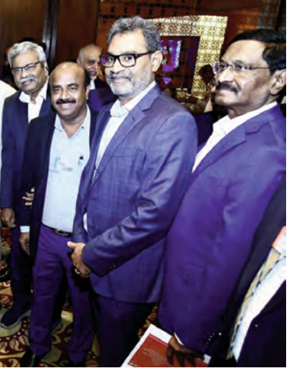
20 లక్షల మంది రైతులు ప్రకృతి సిద్ధం చేస్తున్నారని తెలిపారు. దీనివల్ల భూసారం పెరగడంతో పాటు ఎరువుల దిగుమతులు తగ్గి స్వయం సమృద్ధి సాధ్యమ

రూఫ్టాప్ వ్యవస్థల ద్వారా ట్రాన్స్మిషన్ సమస్యలను తగ్గించే ప్రయత్నాలు చేస్తున్నామని వివరించారు. ప్రస్తుతం రాష్ట్రంలో 20 లక్షల ఎకరాల్లో