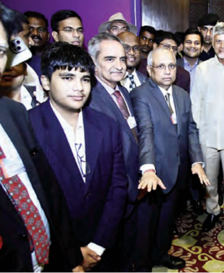
వాహనాలు, వికేంద్రీకర్త ఇందన వ్యవస్థలో భవిష్యత్ అవసరాలని పేర్కొన్నారు. ఏపీలో ఇప్పటికే “టోటోమర్ పాలసీ” అమలు చేస్తున్నామని, సోలార్

పరిశ్రమ, పాలం విద్యుత్ ఉత్పత్తి కేంద్రాలుగా మారాలి అవసరం ఉందని చంద్రబాబు అభిప్రాయ పడ్డారు. గ్రీన్ ఎనర్జీ, బయోగ్యాస్, ఇథనాల్, ఎలక్ట్రిక్