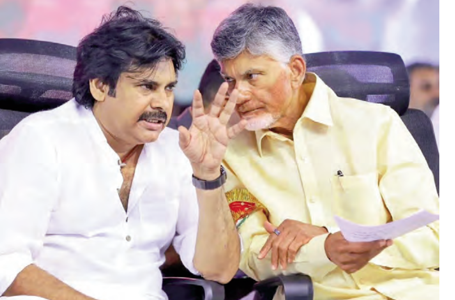
లేదు. పాలనలో కనిపించిన పట్టు ప్రభుత్వ కార్యక్రమాలు వేగంగా అమలువుతున్నప్పటికీ, పాలనపై రాజకీయ నాయకత్వం పూర్తి స్థాయి పట్టు

సాధించలేకపోయిందనే అభిప్రాయం బలపడుతోంది. జిల్లా స్థాయి నుంచి గ్రామ స్థాయి వరకు అధికార యంత్రాంగం అష్టాంశంగా వ్యవహరిస్తోందని, ప్రజాప్రతినిధులను పట్టించుకోని ధోరణి పెరుగుతోంది.