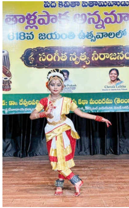
హైదరాబాద్, మే 17, 2026: తెలంగాణ సారస్వత పరిషత్లో ఆదర్శ కళా నిలయం ఆధ్వర్యంలో

ఘనంగా నిర్వహించిన ఆదర్శ కళా నిలయం కార్యక్రమం