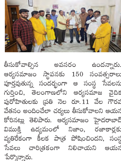
తీసుకోవాల్సిన అవసరం ఉందన్నారు. ఆర్యసమాజం స్థాపనకు 150 సంవత్సరాలు పూర్తవుతున్న సందర్భంగా ఆ సంస్థ సేవలను గుర్తించి, తెలంగాణలోని ఆర్యసమాజ వైదిక పురోహితులకు ప్రతి నెల రూ.11 వేల గౌరవ వేతనం అందించేలా చర్యలు తీసుకోవాలని ఆయన కోరనట్లు తెలిపారు. ఆర్యసమాజం హైదరాబాద్ విమక్తి ఉద్యమంలో నిజాం, రజాకార్లకు వ్యతిరేకంగా కీలక పాత్ర పోషించిందని, సంస్థ సేవలు చారిత్రకంగా నిలిచాయని ఆయన పేర్కొన్నారు.

సికింద్రాబాద్, మే 23 (సాక్షి): తెలంగాణ ఆర్యసమాజానికి చెందిన వైదిక పురోహితులకు ప్రభుత్వం ద్వారా గౌరవ వేతనం కల్పించాలని కోరుతూ బీజేపీ తెలంగాణ రాష్ట్ర అధ్యక్షుడు ఎన్. రామచంద్రరావుకు డాక్టర్ ధర్మతేజ వినివేత్రం అందజేశారు. ఈ సందర్భంగా ఆయన మాట్లాడుతూ రాష్ట్ర ప్రభుత్వం ముస్లిం మత గురువులు, క్రైస్తవ పాదర్లు, దేవాలయ అర్చకులకు ప్రతి నెల గౌరవ వేతనాలు చెల్లించడంతో పాటు వారి సంక్షేమం కోసం పలు పథకాలను అమలు చేస్తోందని తెలిపారు. ఆర్యసమాజానికి చెందిన వైదిక పురోహితులు కూడా గత 150 సంవత్సరాలుగా యజ్ఞాలు, వివాహాలు, గృహప్రవేశాలు, ఇతర వైదిక సంస్కారాలను నిర్వహిస్తూ సమాజ సేవ చేస్తున్నప్పటికీ, వారికి ప్రభుత్వం నుంచి ఎలాంటి గౌరవ వేతనం అందడం లేదని పేర్కొన్నారు. వారి సంక్షేమం కోసం కూడా ప్రత్యేక చర్యలు