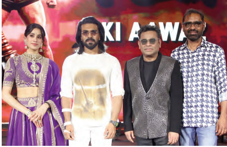
ఎవరూ పోటీగా అనిపిస్తోంది. మీ అందరికీ నా కృతజ్ఞతలు. 'పెద్ది' సినిమాను మేము ఎంతో మనసుపట్టి తీశాం. ప్రతి భావోద్వేగం, ప్రతి