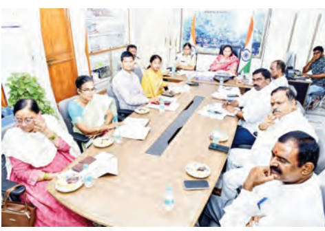
అధికారులతో కూడా చెల్లింపుల ప్రక్రియ కొనసాగుతోందని పేర్కొన్నారు. వర్షాలకు తడిసిన ధాన్యాన్ని కూడా ప్రభుత్వం కొనుగోలు చేస్తుందని సృష్టించారు. ధాన్యం కొనుగోలు విషయంలో రైతులను ఇబ్బంది పెట్టే మద్దతులను, మిల్లర్లపై కఠిన చర్యలు తీసుకుంటామని హెచ్చరించారు. తాలు, తరుగు పేరుతో రైతులను మోసం చేసే వారిని ఉపేక్షించబోమన్నారు. ఈ సీజన్లో తెలంగాణ రైతుల నుంచి రికార్డు స్థాయిలో ధాన్యం కొనుగోలు చేసే రూ.45 వేల కోట్లకు పైగా చెల్లింపులు జరుగుతున్నాయని తెలిపారు. పంటల అవకేషనలను కాల్యం పట్ల వాతావరణ కాల్యం పెరగడమే కాకుండా నేల సారవంతత దెబ్బతింటుందని

మహబూబ్ నగర్, మే 24 (సాక్షి బ్యూరో): జిల్లాలో కొనుగోలును వరి ధాన్యం కొనుగోలు ప్రక్రియను వేగవంతంగా పూర్తి చేసి, అకాల వర్షాల వల్ల రైతుల ధాన్యం తడవకుండా చర్యలు తీసుకోవాలని జిల్లా కలెక్టర్ ఖమ్మం గుప్తా అధికారులను ఆదేశించారు. అధికారులకు ఖమ్మం కలెక్టరేట్ నుంచి ఉప ముఖ్యమంత్రి మల్ల భట్టి విక్రమార్క హైదరాబాద్ నుంచి రాష్ట్ర పౌర సరఫరాల శాఖ మంత్రి ఉత్తమ కుమార్ రెడ్డి, రాష్ట్ర పంచాయతీ రాజ్, గ్రామీణాభివృద్ధి, గ్రామీణ సీడి సరఫరా, మహిళా శిశు సంక్షేమ శాఖ మంత్రి ధనసీ అనసూయ సీతక్క, రాష్ట్ర ప్రభుత్వ ప్రధాన కార్యదర్శి రామకృష్ణారావు తదితరులు అన్ని జిల్లాల కలెక్టర్లు, సంబంధిత శాఖల అధికారులతో వీడియో కాన్ఫరెన్స్ నిర్వహించారు. ఈ సమావేశంలో ప్యాషీ ప్రాక్టూరిమెంట్, ఈ నెల 25 నుంచి నిర్వహించనున్న ప్రజాపాలన-ప్రగతి ప్రణాళిక మహిళా సంక్షేమ కార్యక్రమాలపై సమీక్ష చేపట్టారు. రాష్ట్రవ్యాప్తంగా ధాన్యం కొనుగోలు పది రోజుల్లోగా యుద్ధ ప్రాతిపదికన పూర్తి చేయాలని ఆదేశించారు. గోదాముల కొరత, లాభిలు, చూరాల సమస్యలు ఉన్న చోట వెంటనే పరిష్కార చర్యలు తీసుకోవాలని సూచించారు. రైతులకు కనీస మద్దతు ధర చెల్లింపులు వేగంగా అందేలా ట్యాట్ ఎంట్రిలు, డేటా ఆప్ డెవలప్ మెంట్ ఎప్పటికప్పుడు పూర్తి చేయాలని తెలిపారు.