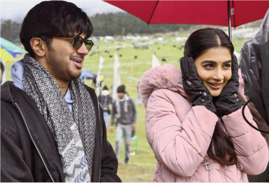
#DQ41, #SLV10 కీలక షెడ్యూల్ పూర్తి- ఆకట్టుకునే వర్కింగ్ స్టిల్స్ రిలీజ్