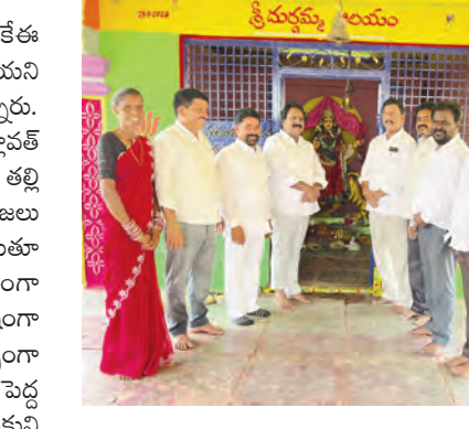
మండల పట్టణ, ముఖ్య నాయకులు, గ్రామ పెద్దలు