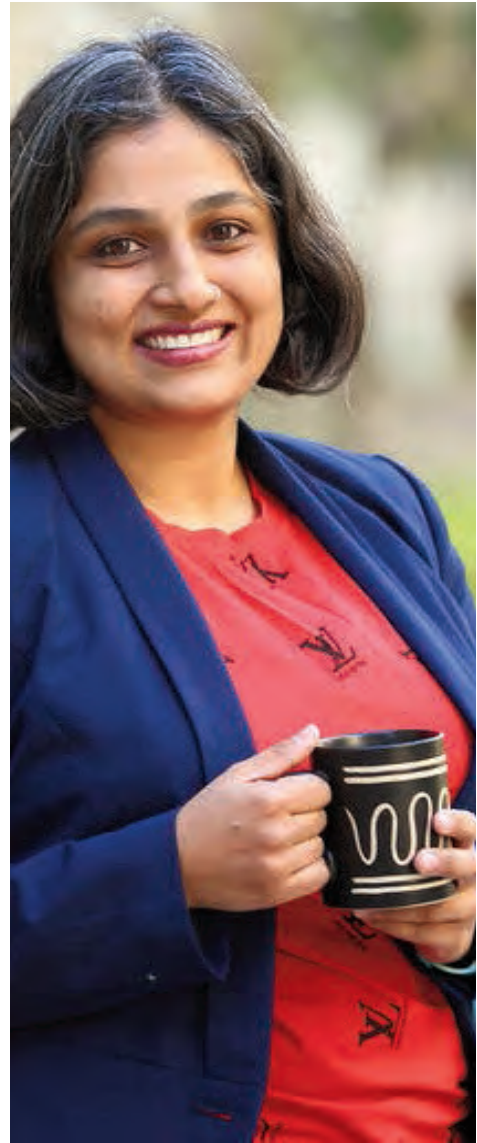
మించిన సమయం ఉండదు. నేటి పొద్దులు బాట, రేపటికి ఆర్థిక బాటకు.