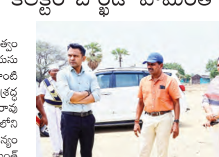
తాగునీరు, సీడ్, వంటి మౌలిక సౌకర్యాలు తప్పనిసరిగా కల్పించాలని సరిబంధిత అధికారులకు సూచించారు. ధాన్యం కొనుగోలు ప్రక్రియలో ఎలాంటి నిర్లక్ష్యం, జాప్యం చోటు చేసుకోకుండా అధికారులు నిరంతరం పర్యవేక్షణ చేపట్టాలని తెలిపారు. రైతులు తీసుకొచ్చిన ధాన్యాన్ని నాణ్యత ప్రమాణాల ప్రకారం వేగంగా కొనుగోలు చేసి, కొనుగోలు అనంతరం ధాన్యాన్ని ఆలస్యం చేయకుండా వెంటనే మిల్లులకు తరలించేలా చర్యలు తీసుకోవాలని

పిట్టూరునాగరం, మే 27. (సాక్షం) : రైతులు పండించిన ప్రతి ధాన్యం గింజను ప్రభుత్వం కొనుగోలు చేస్తుందని, ధాన్యం కొనుగోలు ప్రక్రియను పూర్తిగా పారదర్శకంగా నిర్వహిస్తూ రైతులకు ఎలాంటి ఇబ్బందులు తలెత్తకుండా అధికారులు ప్రత్యేక శ్రద్ధ తీసుకోవాలని జిల్లా కలెక్టర్ బోర్డే హేమంత్ సహదేవరావు అధికారులను ఆదేశించారు. బుద్దవారం ములుగు జిల్లాలోని ప్రతి మండలం గ్రామంలోని పి.ఎ.సి.ఎస్ ధాన్యం కొనుగోలు కేంద్రాల పరిస్థితి జిల్లా కలెక్టర్ బోర్డే హేమంత్ సహదేవరావు వివరాలు అధికారులను అడిగి తెలుసుకున్నారు. జిల్లా అదనపు కలెక్టర్ రెవెన్యూ సి.పావ్. మహేందర్ జి తో కలిసి ఆయన ధాన్యం కొనుగోలు కేంద్రాలను పరిశీలించారు. ఈ సందర్భంగా కొనుగోలు కేంద్రంలో జరుగుతున్న ధాన్యం సేకరణ ప్రక్రియ, రైతులకు అందుతున్న సౌకర్యాలు, ధాన్యం తూకం విధానం, తేమ శాతం నమోదు, రికార్డుల నిర్వహణ, ధాన్యం నిల్వ విధానం తదితర అంశాలను జిల్లా కలెక్టర్ క్షుణ్ణంగా అధ్యయనం చేశారు. ధాన్యం కొనుగోలు కేంద్రాలలో రైతులకు