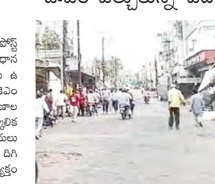
చేరుకుంటుంటారు. అయితే హాస్పిటల్ ప్రవేశ ద్వారం వద్ద పూల దుకాణాలు, బండ్లు, ఇతర వ్యాపారాలు రహదారిని ఆక్రమించడంతో వాహనాల రాకపోకలు పూర్తిగా దెబ్బతిన్నాయి. ముఖ్యంగా అంబులెన్సులు సైతం ట్రాఫిక్లో

వరంగల్, 27 మే (సాక్షం) నగరంలోని అత్యంత రద్దీ ప్రాంతమైన వరంగల్ వాడ్ పోస్ట్ ఆఫీస్ వరసరాలు, సికెఎం ప్రభుత్వ ఆసుపత్రికి వెళ్లే ప్రధాన రహదారిపై నిలకొన్న ట్రాఫిక్ సమస్యలకు ఎట్టకేలకు ఉ పశమనం లభించింది. గత కొంతకాలంగా సికెఎం హాస్పిటల్ మార్గంలో చిరు వ్యాపారులు, పూల దుకాణాల నిర్వాహకులు రోడ్డును ఆక్రమించి శాశ్వత, తాత్కాలిక దుకాణాలు ఏర్పాటు చేయడంతో ప్రజలు తీవ్ర ఇబ్బందులు ఎదుర్కొంటున్నారు. తాజాగా పోలీసులు రంగంలోకి దిగి ఆక్రమణలను తొలగించడంతో స్థానికులు హర్షం వ్యక్తం చేస్తున్నారు. అంబులెన్సులకు ఆటంకం కలిగించిన ఆక్రమిత దుకాణాలు సికెఎం హాస్పిటల్ వరంగల్లో పాటు చుట్టుపక్కల గ్రామాల ప్రజలకు కీలక వైద్య కేంద్రంగా కొనుగోలుతోంది. ప్రతిరోజూ వందలాది మంది రోగులు, గర్భిణీలు, అత్యవసర పరిస్థితుల్లో ఉన్న వారు ఆసుపత్రికి