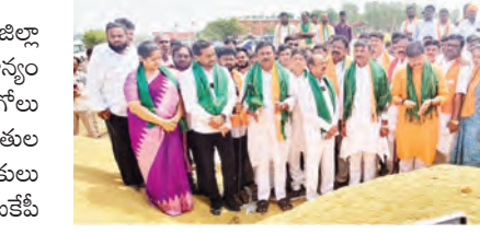
డిమాండ్ చేశారు పౌరసరఫరాల శాఖ మంత్రి శాఖ మంత్రి ఉత్తకుమార్ రెడ్డి రాష్ట్ర ముఖ్యమంత్రి సీఎం రేవంత్ రెడ్డి రెండు రోజుల్లో రైతు భరోసా యాత్ర ముగిస్తుంది రైతుల ఇచ్చిన హామీలను అలాగే ధాన్యం కొనుగోలు కేంద్రాల వద్ద

భూపాలపల్లి, మే 27. (సాక్షం) స్టూన్ రైతు గోస బీజేపీ భరోసా యాత్ర భూపాలపల్లి జిల్లా గణపూర్ మండలం చెల్లూరు రైతు వేదిక వద్ద పరి ధాన్యం కొనుగోలు కేంద్రం చేరుకొని అనంతరం ధాన్యం కొనుగోలు కేంద్రాన్ని సందర్శించిన బీజేపీ పార్టీ నాయకులు రైతుల సమస్యలు అడిగి తెలుసుకున్న బీజేపీ పార్టీ నాయకులు అన్నారు. ఈ సందర్భంగా వారు మాట్లాడుతూ.. ఐకేపీ కేంద్రాల వద్ద రైతులకు మౌలిక సదుపాయాలు కల్పించాలని ట్రాన్స్మిట్, గన్నీ నంచులు సకాలంలో రైతులకు అందివ్వాలి తేమ పేరుతో రైతులను ఇబ్బంది పెట్టకుండా ధాన్యానికి మద్దతు ధర కల్పించి కాంగ్రెస్ ప్రభుత్వం వెంటనే రైతుల నుండి ధాన్యాన్ని కొనుగోలు చేయాలని వారు