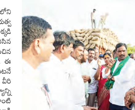
కల్పించడం జరిగిందని లారీ కాంట్రాక్టర్ తో మాట్లాడి బోంబులరావారం తుర్కపల్లి మండలం లో ఉన్న ధాన్యాన్ని అదనపు లాటిలతో లోడ్ చేసి వంగపల్లి గోదాంలో అన్నోడ్ చేయవలసిందిగా తెలిపారు. రైతులు రోజులు తరబడి కొనుగోలు కేంద్రాల వద్ద నిరీక్షించాల్సిన పరిస్థితి రాకూడదని, ధాన్యం త్వరితగతిన కొనుగోలు చేసి మిల్లులకు తరలించేలా చర్యలు తీసుకోవాలని అధికారులకు స్పష్టం చేశారు. రైతుల ధాన్యం కొనుగోలు ప్రక్రియలో గోదాం వద్ద అన్నోడ్ విషయంలో ఏ అధికారి, ఏ కాంట్రాక్టర్ నిర్లక్ష్యం వహించిన చర్యలు తప్పవని తెలిపారు. వర్షాలకు

తుర్కపల్లి సాక్షి స్టూన్.. యాదాద్రి భువనగిరి జిల్లా తుర్కపల్లి మండలం కేంద్రంలోని ధాన్యం కొనుగోలు కేంద్రాన్ని లిలింగాణ రాష్ట్ర ప్రభుత్వ విప్, ఆలేరు ఎమ్మెల్యే బీర్ అయిలయ్య సందర్శించి అక్కడి పరిస్థితులను పరిశీలించారు. మంగళవారం కురిసిన అకాల వర్షాలకు కొనుగోలు కేంద్రంలో నిల్వ ఉంచిన ధాన్యం తడవడంతో రైతులు ఆందోళనకు గురయ్యారు. ఈ విషయం తెలుసుకున్న ఎమ్మెల్యే బద్దవారం రోజు వెంటనే కొనుగోలు కేంద్రానికి చేరుకుని రైతులతో మాట్లాడి వీరి సమస్యలను అడిగి తెలుసుకున్నారు. తడిసిన ధాన్యాన్ని స్వయంగా పరిశీలించిన ఎమ్మెల్యే రైతులు ఎలాంటి అదైర్వానికి గురికావద్దని, ప్రభుత్వం రైతుల వక్షాన నిలబడి ప్రతి గింజ ధాన్యాన్ని కొనుగోలు చేస్తుందని భరోసా ఇచ్చారు. అకాల వర్షాల వల్ల రైతులు ఎన్నో కష్టాలు పడుతున్నారని, రైతు శ్రమ వృధా కాకుండా ప్రభుత్వం అన్ని చర్యలు తీసుకుంటుందని తెలిపారు. ధాన్యం కొనుగోలు ప్రక్రియలో ఎలాంటి ఆలస్యం జరగకుండా వెంటనే అదనపు లాటిలను ఏర్పాటు చేసి ధాన్యాన్ని తరలించే చర్యలు చేపట్టాలని సంబంధిత అధికారులను ఆదేశించారు. రైతులకు ఇబ్బందులు కలగకుండా చూడాలని సూచించారు. అదేవిధంగా నూతనంగా వంగపల్లి గోదాముల్ ధాన్యాన్ని నిల్వ చేసేందుకు వేసులు బాటు