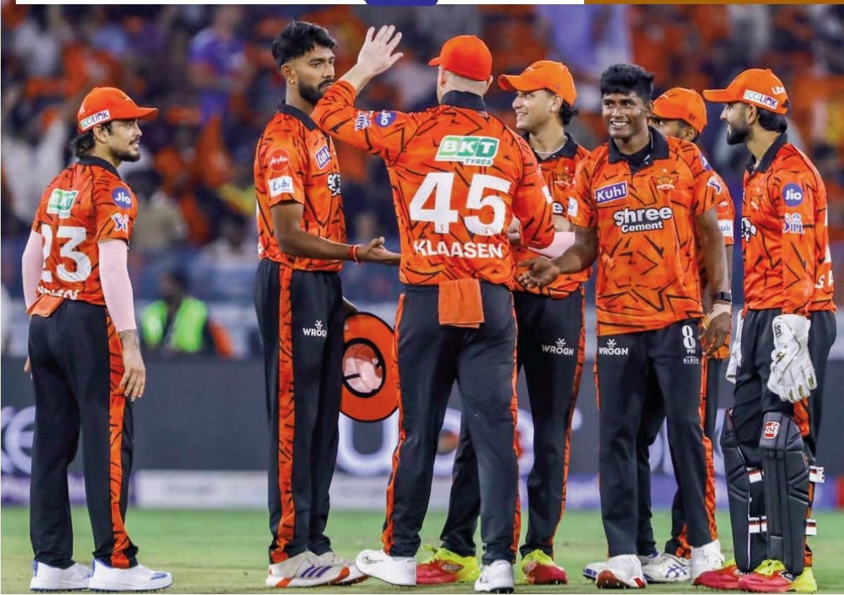
పరిస్థితులను అంచనా వేయకపోవడంతో