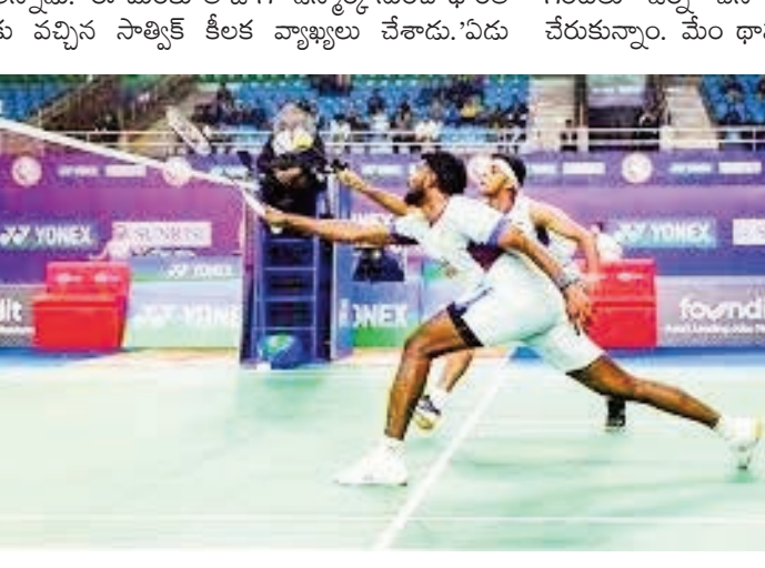
గంటలు జర్మీ చేసి జర్మనీ నుంచి హైదరాబాద్ చేరుకున్నాడు. మేం థామస్ కప్ జెట్ లను ధరించి ఉన్నాం. అయినప్పటికీ జర్మనీ ఎయిర్పోర్ట్ లో ఒక్కరు కూడా మీరేదరు? అ పతకాలు ఏంటి? అని కూడా మమ్మల్ని అడగలేదు. అక్కడ ఇండియన్స్, అందులో కొందరు మన తెలుగు వాళ్ళు కూడా ఉన్నారు. అయితే ప్రస్తుతం అందరూ ఐపీఎల్, పాలిటిక్స్ పైనే దృష్టి పెడుతున్నారు. వాటితోనే బిజీగా ఉన్నారు. మేం 2022లో గోల్డ్ మెడల్ తీసుకొచ్చాం. అప్పుడు

2026 థామస్ కప్ టోర్నమెంట్ లో కాంస్య పతకం సాధించినప్పటికీ తమకు తగిన గుర్తింపు దక్కలేదని భారత స్టార్ షట్లర్ సాత్విక్ సాయిరాజ్ ఆవేదన వ్యక్తం చేశాడు. ప్రతిష్టాత్మక టోర్నీలో పతకం సాధించి స్వదేశానికి వస్తే, ఎయిర్పోర్ట్ లో కనీసం స్వాగతం కూడా లభించలేదని అన్నాడు. అభిమానులు ఎవరు కూడా స్వాగతం పలికేందుకు ఎయిర్పోర్టుకు రాకపోవడం తనను ఎంతో బాధించిందని సాత్విక్ అన్నాడు. అందుకే భవిష్యత్ లో తన పిల్లలను బ్యాడ్మింటన్ ఆడించని తెలిపాడు. బ్యాడ్మింటన్ కు గుర్తింపు లభించడం లేదని సాత్విక్ అభిప్రాయపడ్డాడు. దేశ ప్రజలు కూడా ప్రస్తుతం క్రికెట్ (ఐపీఎల్), రాజకీయాలపైనే ఎక్కువగా ఫోకస్ చేస్తున్నారని అన్నాడు. ఈ పరిణామాలు చూస్తుంటే, భారత్ లో బ్యాడ్మింటన్ ఆటను ప్రోమోషన్ గేమ్ గా చూడడం లేదా? అనే సందేహం కలుగుతుందని