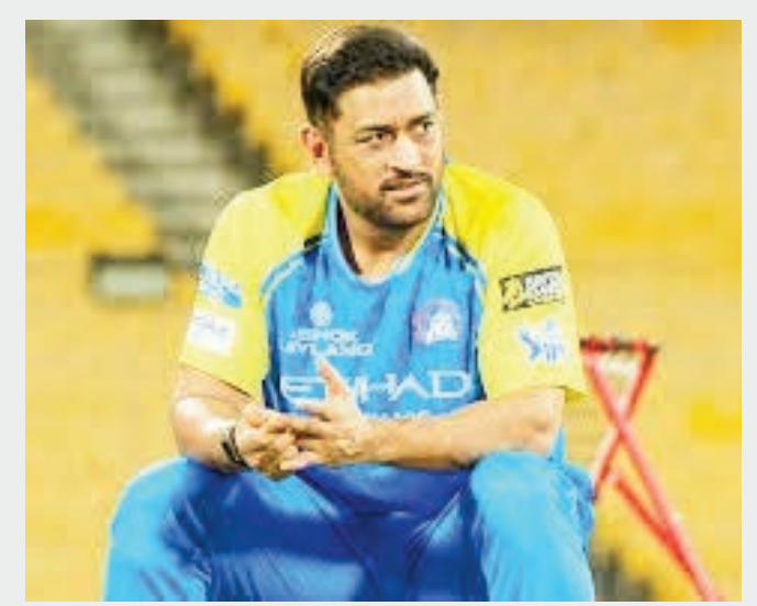
ఆయన వాటా కోట్లాది రూపాయల విలువ చేసింది. అదేవిధంగా, సెకండ్ హ్యాండ్ కార్ల

ధోని పెట్టిన పెట్టుబడి పది రెట్లు పెరిగే అవకాశం ఉంది. చిన్న వ్యాపారుల కోసం డిజిటల్ లెడ్జర్ సేవలను అందించే 'ఖాతాబుక్' యాప్ లో ధోని 2020లో పెట్టుబడి పెట్టాడు. ఈ సంస్థలో