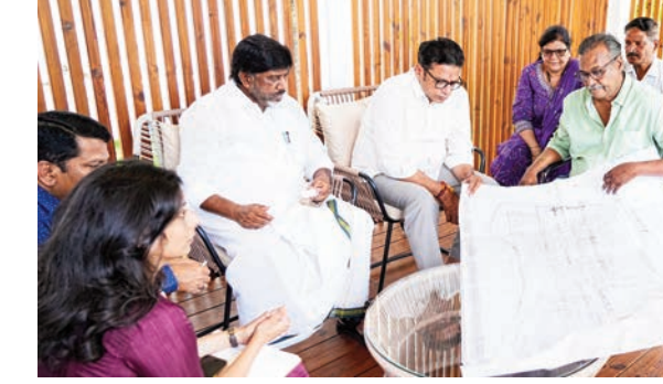
మూసీ పునర్నివాసానికి తమ వంతు సహకారం అందిస్తామని తెలిపారు.