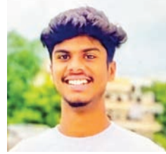
తీవ్రమైన కత్తిపోట్లు కావడంతో యువన్ అక్కడికక్కడే ప్రాణాలు కోల్పోయాడు.