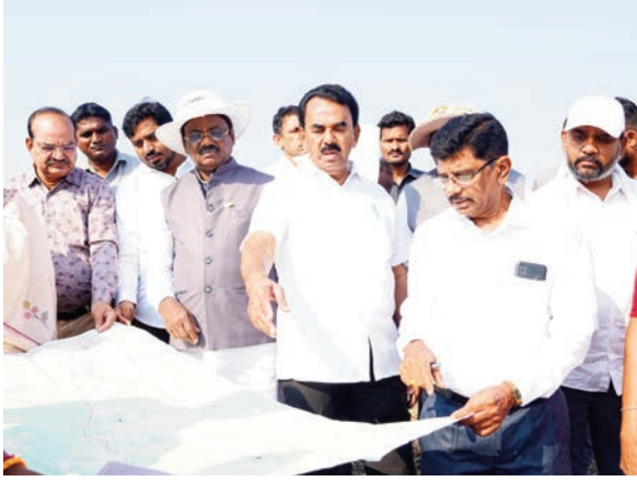
నెల 10న ప్రధాని నరేంద్ర మోడీ తెలంగాణ పర్యటనకు వస్తున్న నేపథ్యంలో, వికసిత భారత్ అని చెప్పుకునే కేంద్రం ఈ ప్రాజెక్టు విషయంలో పెద్ద మనసు చాటుకోవాలని కోరారు. బీజేపీ ప్రజాప్రతినిధులు ఈ అంశాన్ని ప్రధాని దృష్టికి తీసుకెళ్లాలని సూచించారు. ఒక్క యూనిట్ కరెంటు కూడా ఖర్చు లేకుండా గ్రామీణి ద్వారా ప్రీపాద్ ఎల్లెంపల్లి ప్రాజెక్టులో నీటిని తరలించే ఈ బ్యూటర్ కార్యాచరణ పూర్తి చేస్తామని, ఈ విషయంలో ప్రతిపక్షాలు రాజకీయ విమర్శలు మానుకుని సహకరించాలని మంత్రి జూపల్లి కోరారు. ఉమ్మడి ఆదిలాబాద్ లోని మూడు జిల్లాలకు సాగు నీరు అందించాలని ప్రభుత్వం నిర్ణయం తీసుకుందని తెలిపారు. 150 మీటర్ల ఎత్తులో బ్యారేజీ నిర్మాణం జరుగుతుందని మంత్రి వెల్లడించారు. మహారాష్ట్ర ప్రభుత్వంతో చర్చలు జరుగుతున్నాయని తెలిపారు. ముంపుకు గురయ్యే ప్రాంతాలకు సస్య పరిహారం చెల్లిస్తామని చెప్పారు. ఎల్లండి(మే 10) తెలంగాణకు వస్తున్న ప్రధాని మోడీ 'వెడమనసుతో' ప్రాజెక్టు నిర్మాణానికి అనుమతులు ఇవ్వాలని కోరారు. ఆర్థికంగా ఎన్ని ఇబ్బందులు ఉన్నా ప్రాణహిత ప్రాజెక్టు నిర్మాణాన్ని ముందుకు తీసుకెళ్లాలని మంత్రి జూపల్లి కృష్ణారావు వెల్లడించారు. గత ప్రభుత్వ హయాంలో నిర్మాణానికి

గడ్డం వివేక్ వెంకట స్వామి, ఎమ్మెల్యేలు, అధికారులు పరిశీలించారు. నీటి లభ్యతపై ఇంగిషన్ అధికారులతో చర్చించారు. నాలు పడవలపై నదీ ప్రవాహాన్ని మంత్రిలు పరిశీలించారు. అనంతరం మంత్రి జూపల్లి మాట్లాడుతూ.. ఈ