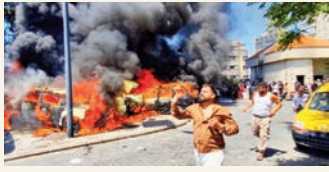
చిత్రం 5 లో..

గోరుక్, జూన్ 10 (సాక్ష్యం): ఇరాన్ తీర ప్రాంతంలోని రాదార్ స్థాపరాలపై దాడి చేసింది. అంతకుముందు హరూజ్ వైపు ఇరాన్ ప్రయోగించిన డ్రోన్లను అమెరికా సైన్యం కూల్చివేసింది. ఈ క్రమంలో రెండు దేశాల మధ్య మరోసారి ఉద్రిక్తత చోటుచేసుకుంది. దాంతో ఈ దేశాల మధ్య శాంతి