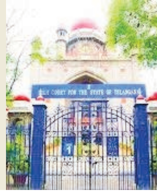
చిత్రం 2 లో..

భర్తీ ప్రక్రియను పూర్తి చేసిన మెడికల్ బోర్డు హైదరాబాద్, జూన్ 10 (సాక్ష్యం): తెలంగాణలోని ప్రభుత్వ వైద్య కళాశాలల్లో 433 అసిస్టెంట్ ప్రొఫెసర్ పోస్టుల భర్తీ పక్రియ పూర్తయింది. తుది మెరిట్ లిస్ట్ తో