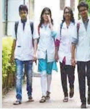
చిత్రం 2 లో..

ఇటీవల వినియోగించుకోవాలన్న కమిషన్ హైదరాబాద్, జూన్ 10 (సాక్ష్యం): ఈనెల 25 నుండి ప్రారంభం కానున్న ఎన్ఐఆర్ కార్యక్రమంలో ఐటీ విరివిగా వాడుకోని ఓటరు నమోదు పక్రియలో పూర్తి పారదర్శకంగా ఎలాంటి తప్పులకు తావివకుండా ఎన్ఐఆర్ ప్రక్రియను పక్కనపెట్టి నిర్వహించాలని రాష్ట్ర ఎన్నికల కమిషన్ అధికారి