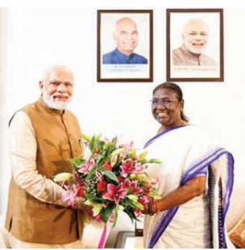
చిత్రం 2 లో..

న్యూఢిల్లీ, జూన్ 10 (సాక్ష్యం): నరేంద్ర మోడీ భారత ప్రధానిగా పద్యాలను చేపట్టి బుధవారం 12 ఏళ్లు పూర్తయ్యాయి. అలాగే అత్యధిక కాలం ప్రధానిగా కొనసాగిన అరుదైన రికార్డును కూడా ఆయన సొంతం చేసుకోవచ్చును. ఇప్పటివరకు ఈ రికార్డు నెహ్రూ పేరు మీద ఉంది. భారత రాజ్యాంగం అమల్లోకి వచ్చాక జరిగిన తొలి ఎన్నికల్లో కాంగ్రెస్ గెలిచాక 1952 మే 13న ఆయన ప్రధానిగా బాధ్యతలు చేపట్టారు. 1964 మే 27న మరణించేదాకా 4,398 రోజులపాటు నిరంతరాయంగా