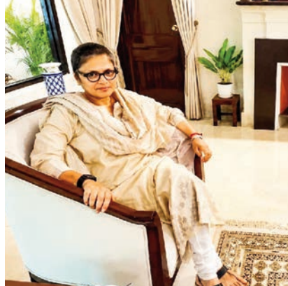
చిత్రం 5 లో..

న్యూఢిల్లీ, జూన్ 10 (సాక్ష్యం): తృణమూల కాంగ్రెస్ పార్టీని కాంగ్రెస్ లో విలీనం చేయనున్నారని వస్తున్న వార్తలను మమతా బెనర్జీ నేతృత్వంలోని టీఎంసీ వర్గాలు బుధవారం ఖండించాయి. తమకు అలాంటి ఆలోచన ఏదీ లేదని స్పష్టం చేశాయి. మంగళవారం టీఎంసీ అధినేత్రి మమతా బెనర్జీ, కాంగ్రెస్ మాజీ అధ్యక్షురాలు సోనియా గాంధీ మధ్య భేటీ జరిగింది. అంతకు ముందు రోజు ఢిల్లీలో జరిగిన ఇండియా కూటమి సమావేశంలో వీరిద్దరూ ఆవిగంసం చేసుకున్న ఒక ఫోటోను కాంగ్రెస్ పార్టీ విడుదల చేసింది. అయితే ఆ ఇరువురు మహిళా నేతల సమావేశానికి సంబంధించిన వివరాలను మాత్రం ఇరుపార్టీలు అధికారికంగా వెల్లడించలేదు. ఈ నేపథ్యంలోనే కాంగ్రెస్ లో టీఎంసీ విలీనంపై ఊహగానాలు ఊపందుకున్నాయి. అయితే కాంగ్రెస్ లో