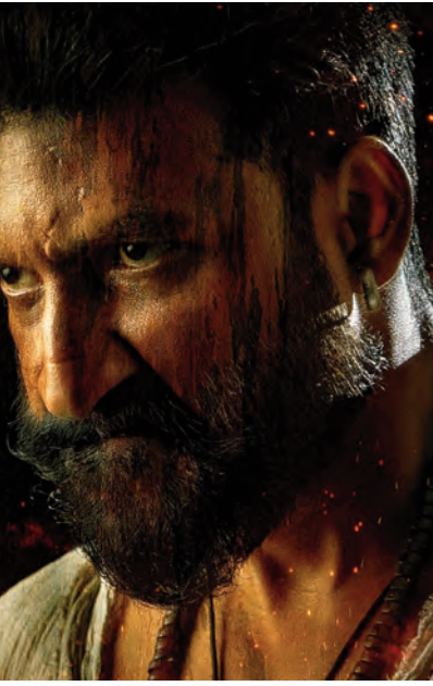
లవెల్లో ఉంది. డివోపీ మోడల్, హీరో పాత్రను బిల్డప్ చేసి రిలీజ్ చేసిన తీరు