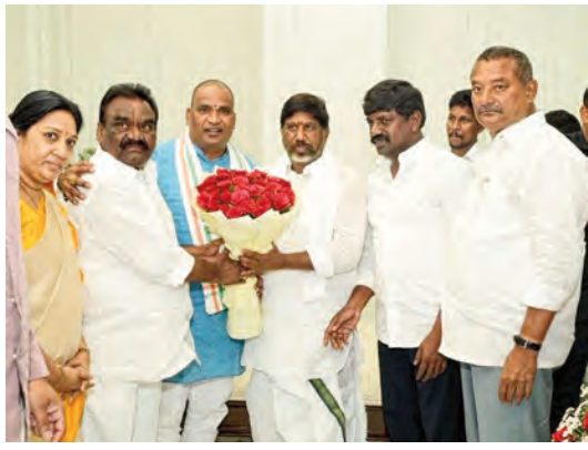
యాదగిరిగుట్ట సాక్షి స్యూస్.