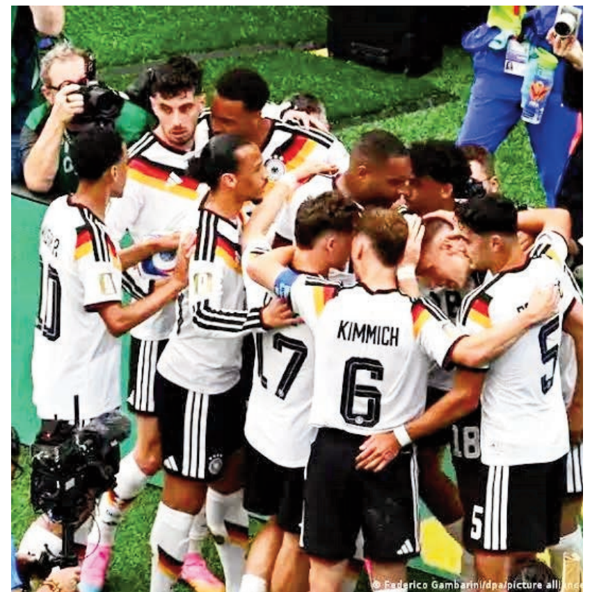
బ్రెజిల్ జర్మనీతో సమానంగా నిలదగింపడంలో జర్మనీ విఫలమైంది. కాగా, ఈ మ్యాచ్లో కురసావేపు జర్మనీ 7-1 ఈసారి బ్రెజిల్ సాధించడమే లక్ష్యంగా ఈ

నిలదగా రాజీస్థందనందంలో సందేశం లేదు. గ్రూప్ దశను దాటడంలో జర్మనీ విఫలమైంది. కాగా, ఈ మ్యాచ్లో కురసావేపు జర్మనీ 7-1 ఈసారి బ్రెజిల్ సాధించడమే లక్ష్యంగా ఈ