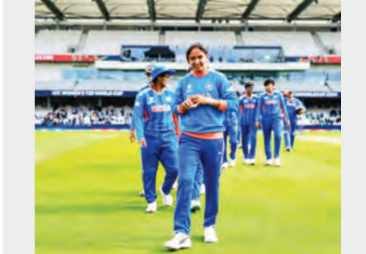
తిప్పింది” అని చెప్పింది. అలాగే బౌలింగ్ విభాగం గురించి మాట్లాడుతూ.. పిచ్పై బంతి కాస్త టర్నింగ్ అవుతున్న సమయంలో శ్రీ చరణి, షఫాబీ వర్మలు అద్భుతంగా బౌలింగ్ చేసి లంక బ్యాటర్లకు సహాల్ వినీరారని, కానీ మిగతా బౌలర్ల నుంచి వారికి ఆశించిన స్థాయిలో సపోర్ట్ లభించలేదని కెప్టెన్ అభిప్రాయపడింది. ఇలాంటి పిచ్పై ఎలా బౌలింగ్ చేయాలో మిగతా స్పిన్లర్లు కూడా ఆలోచించుకోవాలి. తన కెరీర్లో 200వ అంతర్జాతీయ టీ20 మ్యాచ్ మైల్స్టోన్ను అందుకోవడంపై, మహిళల క్రికెట్ పుష్టిపై హర్షన్ ప్రీత్ ఆసక్తికర వ్యాఖ్యలు చేసింది. “నా ఈ సుదీర్ఘ ప్రయాణంలో ఎన్నో విషయాలు నేర్చుకున్నాను. ఎన్నో సానుకూల క్షణాలతో పాటు, ఇలాంటి క్లిష్ట పరిస్థితుల్లో బలంగా నిలబడాలి, సానుకూల దృక్పథంతో ఆట గురించి ఎలా ఆలోచించాలనేది క్రికెట్ నాకు నేర్పింది. ఒక కెప్టెన్గా అప్పుడు నా జట్టు సభ్యులతో మాట్లాడి, వారిలో ఆత్మవిశ్వాసాన్ని నింపాలి సమయం ఇది. రాబోయే తదుపరి మ్యాచ్లకు ఇంకా రెండు మూడు రోజుల సమయం ఉంది. మేము అందరం కలిసి కూర్చుని ఏకైక దౌపాలు జరిగాయో సమీక్షించుకుంటాం. దానికి తగ్గట్టుగా తదుపరి మ్యాచ్కు అత్యుత్తమ ప్లేయింగ్ ఎలెక్షన్లు ఎంపిక చేస్తాం. రాబోయే రెండు మ్యాచ్లో ఒక జట్టుగా మేము బలంగా పోరాడుతామని నమ్మకం నాకు ఉంది” అని హర్షన్ ప్రీత్ కౌర్ ఆశాభావం వ్యక్తం చేసింది.

మహిళల టీ20 వరల్డ్ కప్ 2026 టీమ్ మ్యాచ్ లో దక్షిణాఫ్రికా చేతిలో ఎదురైన పరాజయంపై టీమిండియా కెప్టెన్ హర్షన్ ప్రీత్ కౌర్ స్పందించింది. మ్యాచ్ అనంతరం మాట్లాడిన హర్షన్ ప్రీత్ కౌర్.. లభించిన అవకాశాలను చేజార్చుకోవడం వల్లే మ్యాచ్ ఓడిపోవచ్చని వచ్చిందని నిజాయితీగా ఒప్పుకుంది. “మ్యాచ్ మధ్యలో మాకు కొన్ని మంచి అవకాశాలు వచ్చాయి. కానీ దురదృష్టవశాత్తూ మేము వాటిని అందుకోలేకపోయాం. అయితే టోర్నమెంట్లో మాకు ఇంకా రెండు మ్యాచ్లు మిగిలి ఉన్నాయి. ఈ సమయంలో మేము పాజిటివ్గా ఉంటాం.. రాబోయే మ్యాచ్లపై దృష్టి పెట్టడం చాలా ముఖ్యం” అని హర్షన్ ప్రీత్ పేర్కొంది. దక్షిణాఫ్రికా జట్టును విజయతీరాలకు చేర్చిన మారిజాన్ కాస్ ఇన్నింగ్స్ను హర్షన్ ప్రీత్ ప్రశంసించింది. అయితే ఆమె ఇచ్చిన రెండు కీలక క్యాచ్లను భారత్ ఫీల్డర్లు పదిలేకారని గుర్తు చేసింది. “ఈరోజు కాస్ అద్భుతంగా ఆడి మ్యాచ్ను మా నుంచి లాగేసుకుంది. అయితే ఆమె బ్యాటింగ్ చేస్తున్నప్పుడు మాకు రెండు కీలక ఛాన్సులు లభించాయి. ఈ స్థాయి క్రికెట్లో లభించిన అవకాశాలను పదిలేస్తే ఎవరూ మనకు విజయాన్ని ఊరేకే ఇవ్వరు. సరిగ్గా అదే మ్యాచ్ను మలుపు