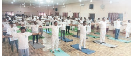
అభ్యాసకులు మరియు ఇతర ప్రజాప్రతినిధులు, అధికారులు పాల్గొన్నారు.