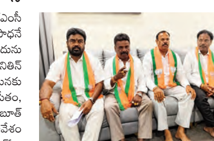
జీహెచ్ఎంసీ ఎన్నికలు, 2028 ఎన్నికల్లో విజయమే లక్ష్యంగా కార్యకర్తలకు జాతీయ అధ్యక్షుడు దిశానిర్దేశం చేయనున్నట్లు బీజేపీ మేధుల్-మల్కాజిగిరి జిల్లా ఉ

ఉప్పల్, జూన్ 23 (సాక్షి) : రానున్న జీహెచ్ఎంసీ ఎన్నికలు, 2028 అసెంబ్లీ ఎన్నికల్లో అధికార సాధనే లక్ష్యంగా భావించి జనతా పార్టీ కార్యచరణకు పదును పెడుతోంది. ఈ నేపథ్యంలో పార్టీ జాతీయ అధ్యక్షుడు నితిన్ నబన్ ఈ నెల 28న తెలంగాణ రాష్ట్ర పర్యటనకు రానున్నారు. ఈ సందర్భంగా పార్టీ సంస్థాగత బలోపేతం, ప్రత్యేక ఇంటిన్సిటీ రివిజన్ (ఎన్ఐఆర్) కార్యక్రమం, టాక్ స్టాయి సమన్వయం తదితర అంశాలపై కీలక సమావేశం నిర్వహించనున్నారు. టాక్ స్టాయి అధ్యక్షులు, బీఎంఎ-2లు, డివిజన్ అధ్యక్షులు, జిల్లా పధాధికారులు, రాష్ట్ర నాయకులు ఈ సమావేశంలో పాల్గొనున్నారు. పార్టీని క్షేత్రస్థాయిలో మరింత పటిష్ఠం చేయడంతో పాటు, రానున్న