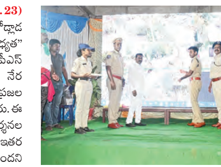
ఏర్పాటు చేసిన 10 సీసీ కెమెరాలను జిల్లా ఎస్పీ ప్రారంభించారు. సీసీ కెమెరాల నిపుణుల ద్వారా గ్రామంలో భద్రత మరింత బలోపేతం అవుతుందని, ప్రతి గ్రామం సీసీ కెమెరాల రక్షణలో ఉండేలా ప్రజలు సహకరించాలని