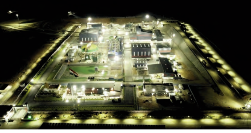
కార్యకలాపాలు చేపట్టగా, అవసరమైన ప్రాసెసింగ్ మొదటి ఏడాదిలో 400 కిలోల బంగారు ఉత్పత్తి

పొందుతోంది. ప్రభుత్వం కేటాయించిన 1,500 ఎకరాల్లో తొలి దశలో 600 ఎకరాల్లో మైనింగ్ ప్లాంట్లు ఇప్పటికే ఏర్పాటు చేశారు. రెండో దశలో మిగిలిన ప్రాంతానికి విస్తరణ చేపట్టనున్నారు.