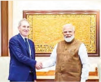
చిత్రం 4 లో

న్యూఢిల్లీ,జూన్ 25(సాక్ష్యం): భారత్ లో తన వ్యాపార కార్యకలాపాలను భారీగా విస్తరించేందుకు సిద్ధమైంది అమెరికాకు చెందిన ఈ-కామర్స్ దిగ్గజం అమెజాన్. 2026 నుంచి 2030 వరకు కాలంలో భారత్ లో ఏకంగా 48 బిలియన్ డాలర్ల (సుమారు రూ. 4.53 లక్షల కోట్లు) పెట్టుబడి పెట్టనున్నట్లు గురువారం ప్రకటించింది. అలాగే 2030 నాటికి దేశంలో ఏబి (ఐఐఐఐ), క్లౌడ్ మౌలిక సదుపాయాలను విస్తరించడానికి అదనంగా 13 బిలియన్ డాలర్ల పెట్టుబడి పెట్టనున్నట్లు వెల్లడించింది. కాగా, భారత ప్రధాని నరేంద్ర మోదీతో అమెజాన్ సీఈఓ అండ్ జాస్సీ భేటీ