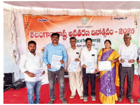
తయారీ వంటి పర్యావరణ అంశాలపై ప్రత్యేక శిక్షణ అందించబడింది. ఈ కార్యక్రమంలో విద్యార్థులు పర్యావరణ పరిరక్షణపై సృష్ట రూపకాలు, మూకాభినయం, ఏకవ్రాణినయం తదితర కళారూపాల ద్వారా ప్రజలకు అవగాహన కల్పించేట్లుగా శిక్షణ పొందారు. ఈ కార్యక్రమాల అమలులో విశేష ప్రతిభ కనబరిచినందుకు