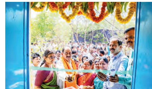
యూనిట్లో ఉపాధి అవకాశాలు కల్పించడం ముఖ్య ఉద్దేశం అన్నారు. ఈ ప్రాజెక్టుకు వీ హబ్ (తెలంగాణ మహిళా పారిశ్రామికవేత్తల హబ్) మరియు స్థానిక జిల్లా