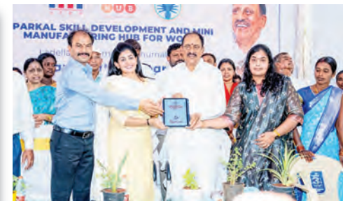
మహిళల కోసం ప్రత్యేకంగా స్కిల్ డెవలప్ మెంట్ అండ్ మిసీ మ్యూసుఫ్యాక్చరింగ్ హబ్ ఏర్పాటు చేయబడింది. స్థానిక యువత, మహిళలకు ఉపాధి అవకాశాలు కల్పించేందుకు జిల్లా యంత్రాంగం మరియు వీ-హబ్ ఆధ్వర్యంలో ఈ కేంద్రాన్ని అభివృద్ధి చేస్తున్నదని అన్నారు. గ్రామీణ ప్రాంతాల్లోని మహిళలకు నైపుణ్యాభివృద్ధి శిక్షణ ఇవ్వడం మరియు స్థానికంగా చిన్న తరహా తయారీ

- మహిళల ఆర్థిక స్వావలంబనకు స్కిల్ డెవలప్ మెంట్ అండ్ మిసీ మ్యూసుఫ్యాక్చరింగ్ హబ్ ప్రారంభం - నాణ్యమైన ఉత్పత్తులతో 'రుద్రమ' బ్రాండ్ కు దేశవ్యాప్త గుర్తింపు తీసుకురావాలి - మహిళల ఆర్థిక సాధికారతే సమాజ అభివృద్ధికి పునాది