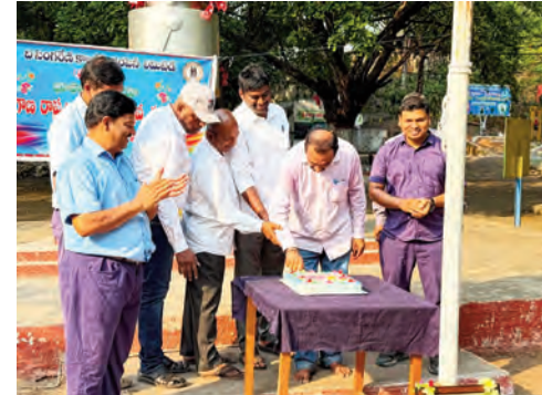
దాశరథి మాటలను స్మరిస్తూ, ఎందరో అమరవీరుల