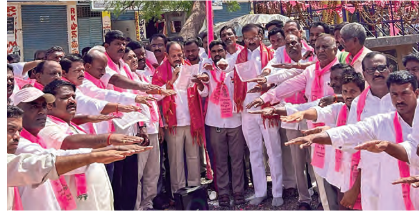
భూమిని తెలిపారు. ప్రభుత్వం కృషి చేసిందని ఆయన అన్నారు. అయితే

రాష్ట్రాన్ని దేశంలోనే వెనక వన్ స్థాయికి తీసుకె అన్ని వర్గాల ప్రజల సంక్షేమం కోసం బీఆర్ఎస్