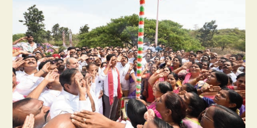
హైదరాబాద్, జూన్ 2 (సాక్ష్యం):

పుష్కర తెలంగాణ కాస్తా ముష్కర తెలంగాణ తెలంగాణ భవన్ లో బీఆర్ఎస్ నేత కేటీఆర్