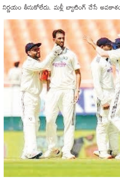
రాకూడదనే లక్ష్యంతో అతడు.. ఇన్నింగ్స్ను