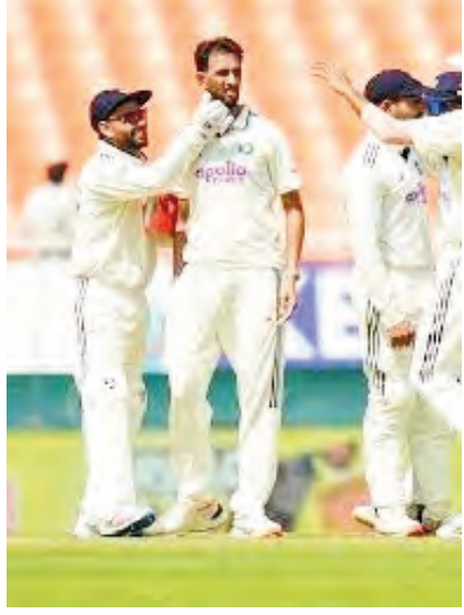
రాకూడదనే లక్ష్యంతో అతడు.. ఇన్నింగ్స్ను